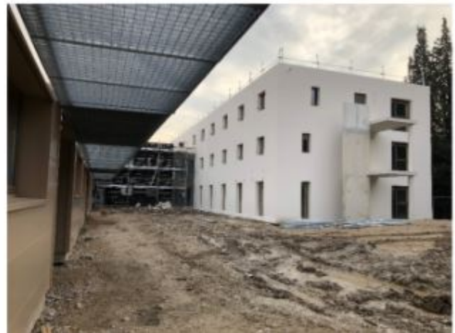
Avancement des travaux.