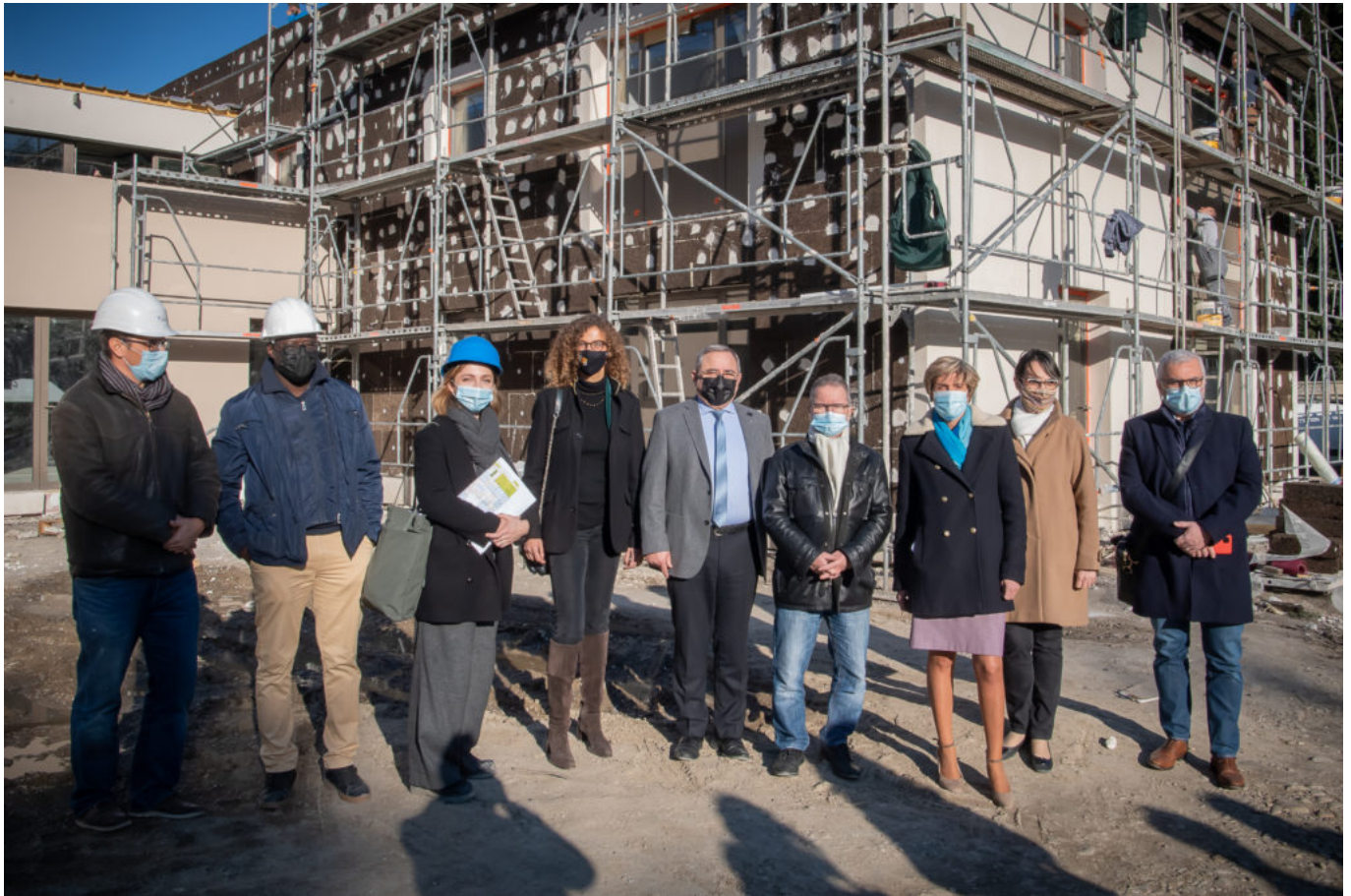
Visite de chantier.