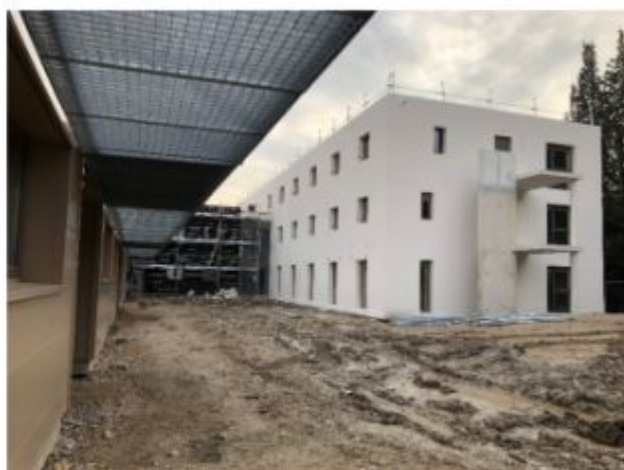
Avancement des travaux.