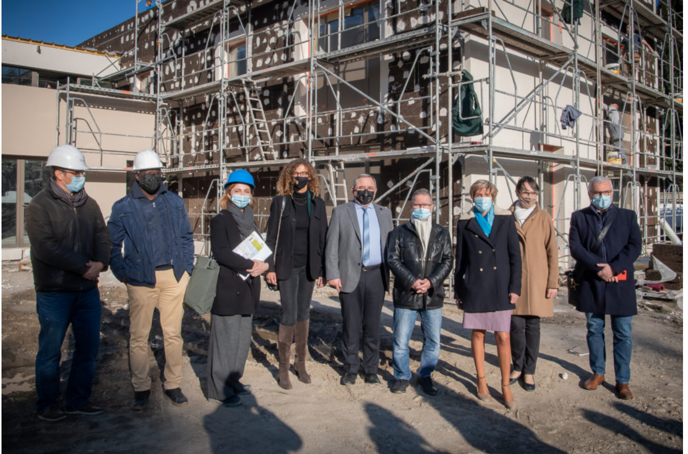
Visite de chantier.