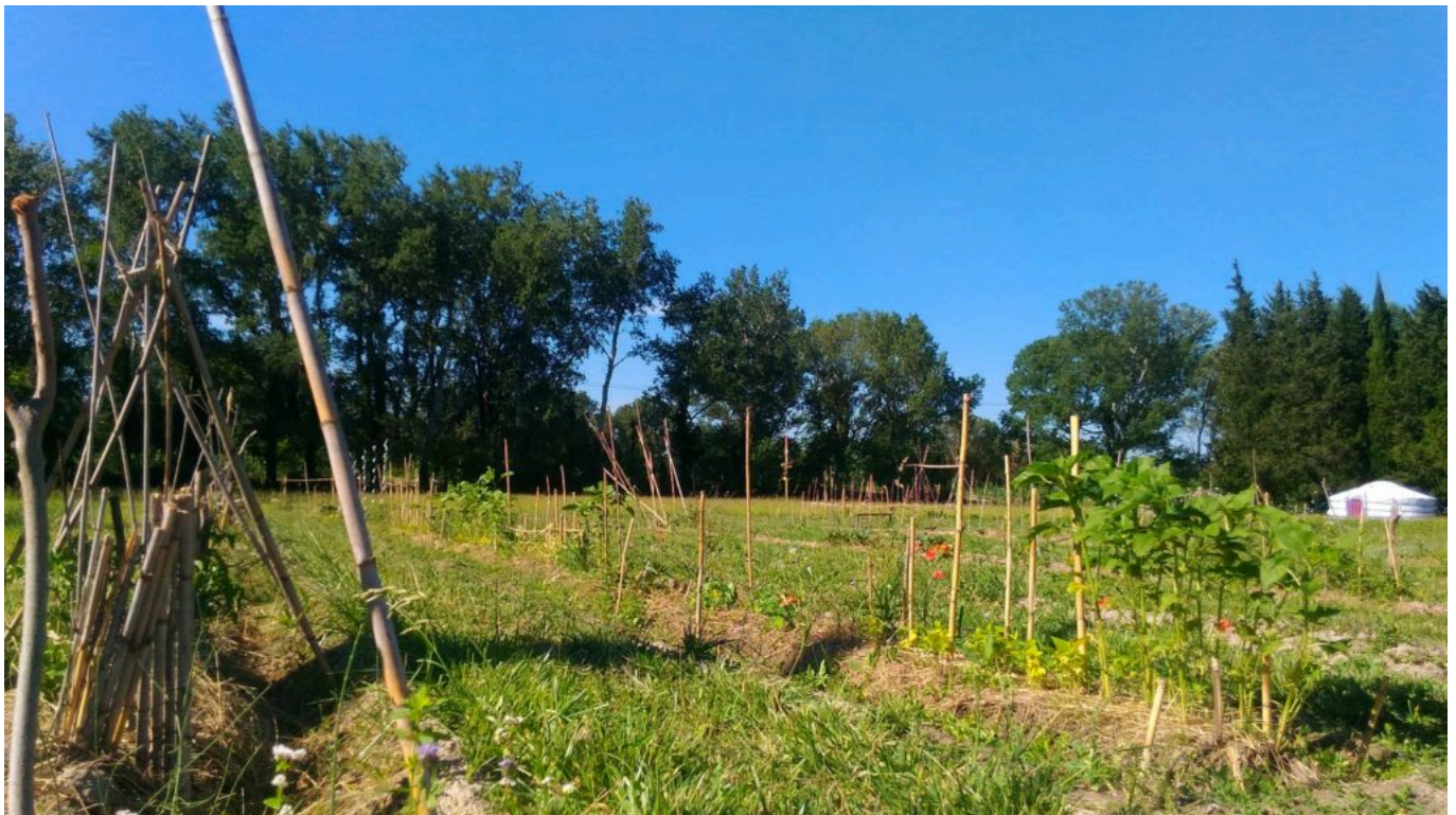
Les parcelles vous attendent à la ferme de la Barthelasse

Ce sont des planches permanentes qui ne bougent pas, d'environ 30m. Le public peut cultiver tout ce qu'il veut. La terre sableuse est hyper fertile, ajoutés à ça le soleil et l'irrigation, c'est le top pour l'agriculture. On arrose tous les mercredis avec un système de goutte à goutte. Chaque planche dispose de deux tuyaux de goutte à goutte, je les laisse tourner deux heures par jardin. Je mets à disposition du broyat, déchets verts broyés qui nourrit le sol en matière organique, protège du vent, de la pluie, du soleil et maintient l'humidité.