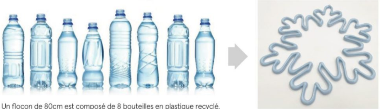
Un flocon de 80cm est composé de 8 bouteilles en plastique recyclé.

Ecrit par Linda Mansouri le 20 juillet 2021