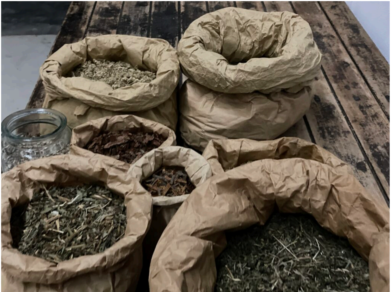
Les tisanes

Ecrit par Mireille Hurlin le 29 décembre 2022