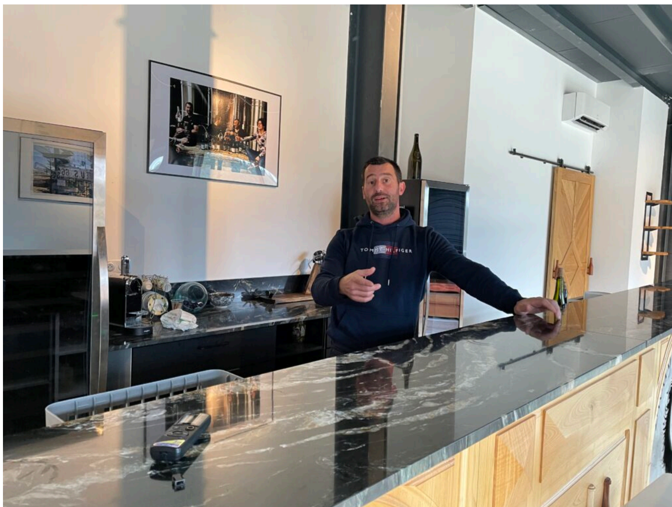
L'espace dégustation

Ecrit par Mireille Hurlin le 29 décembre 2022