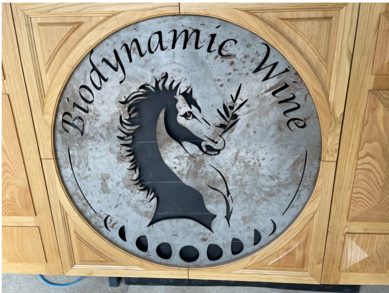
Le blason de Biodynamic Wine le Domaine des carabiniers à Roquemaure

Ecrit par Mireille Hurlin le 29 décembre 2022