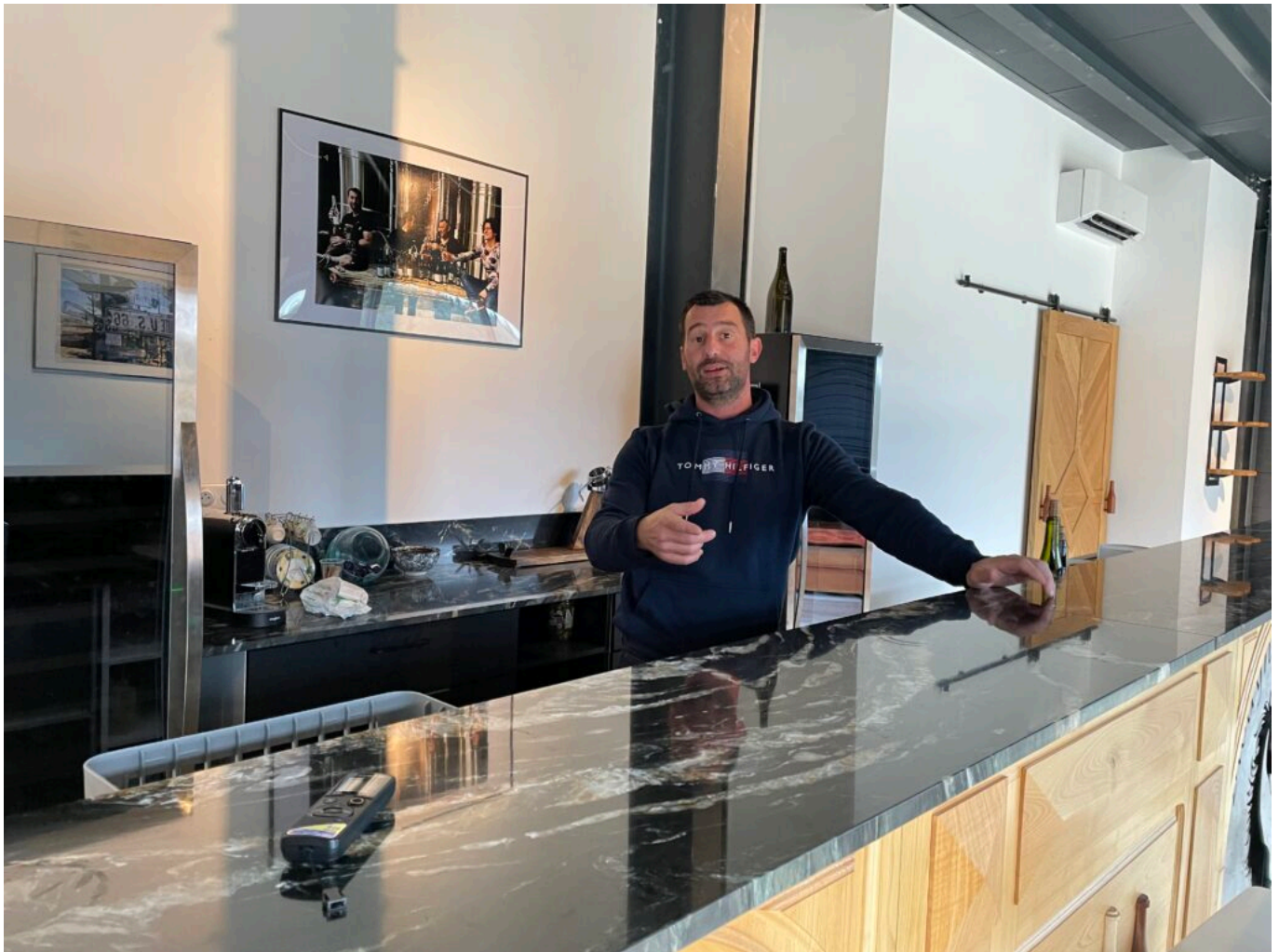
L'espace dégustation

Ecrit par Mireille Hurlin le 29 décembre 2022