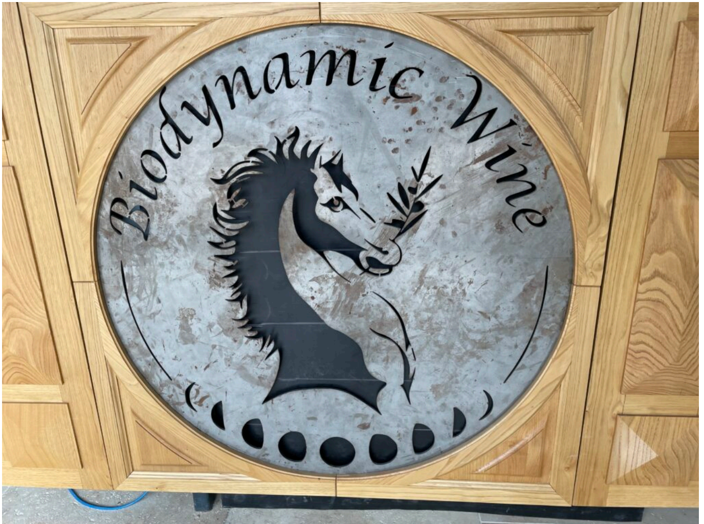
Le blason de Biodynamic Wine le Domaine des carabiniers à Roquemaure

Ecrit par Mireille Hurlin le 29 décembre 2022