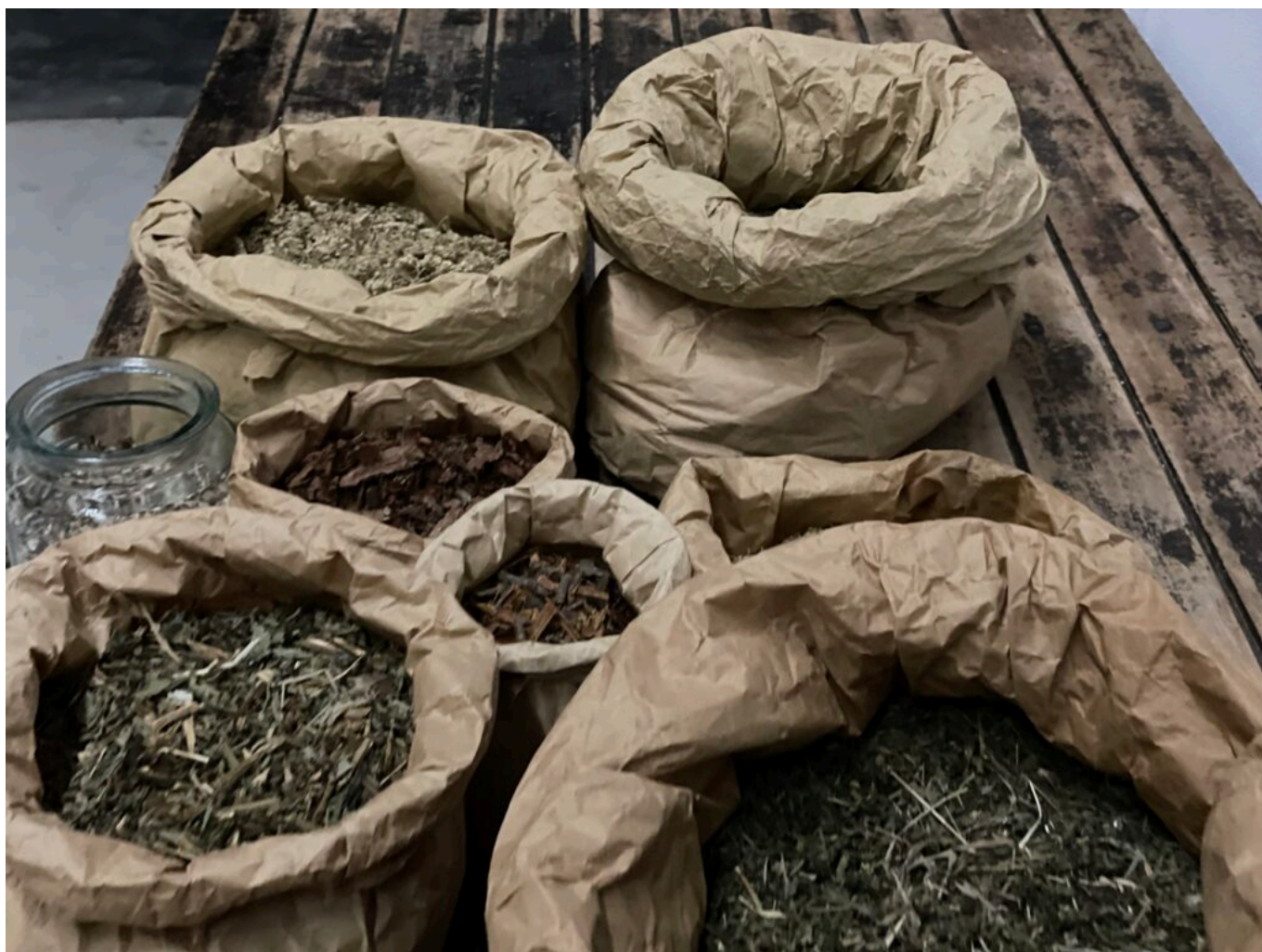
Les tisanes

Ecrit par Mireille Hurlin le 29 décembre 2022