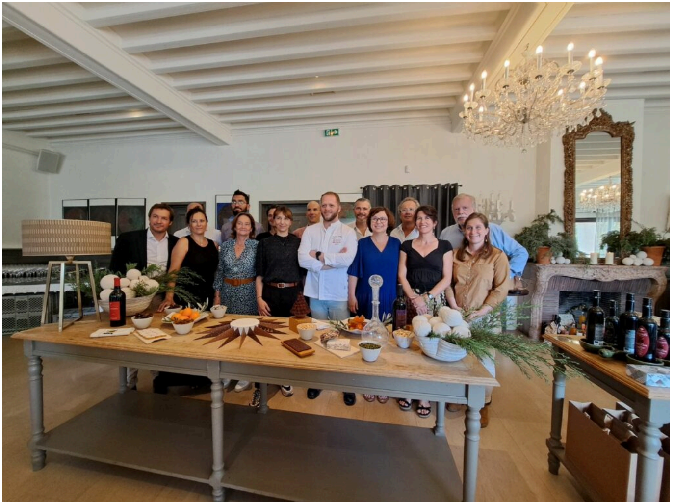
Les membres du Comité Mistral Provence