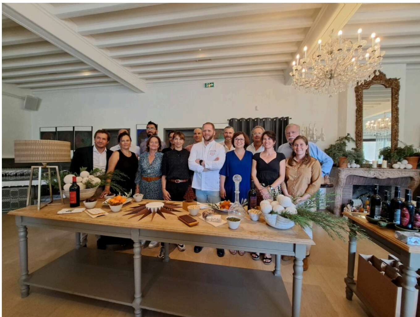
Les membres du Comité Mistral Provence