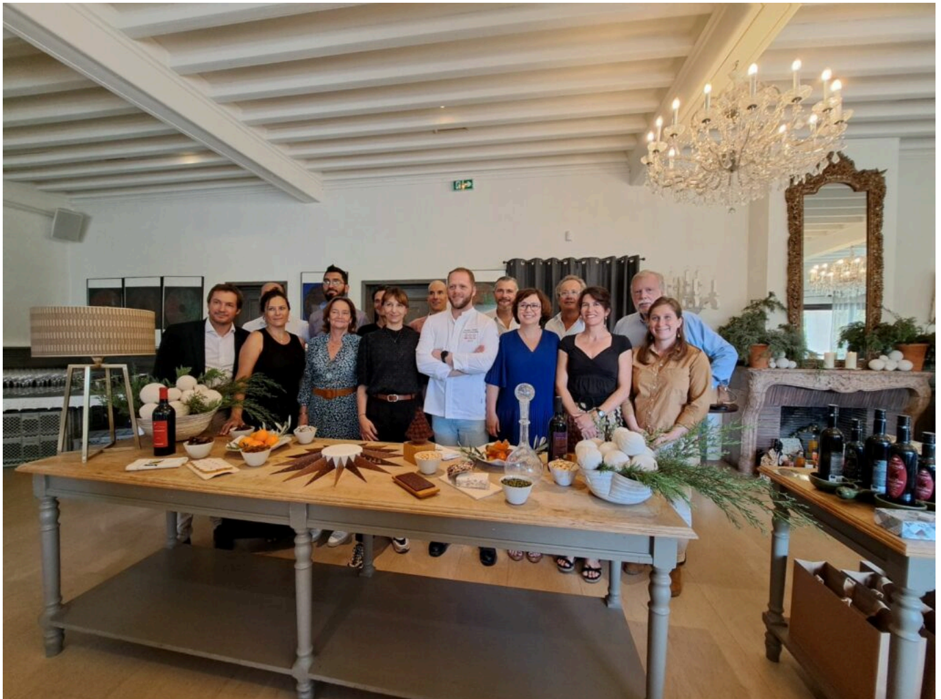
Les membres du Comité Mistral Provence