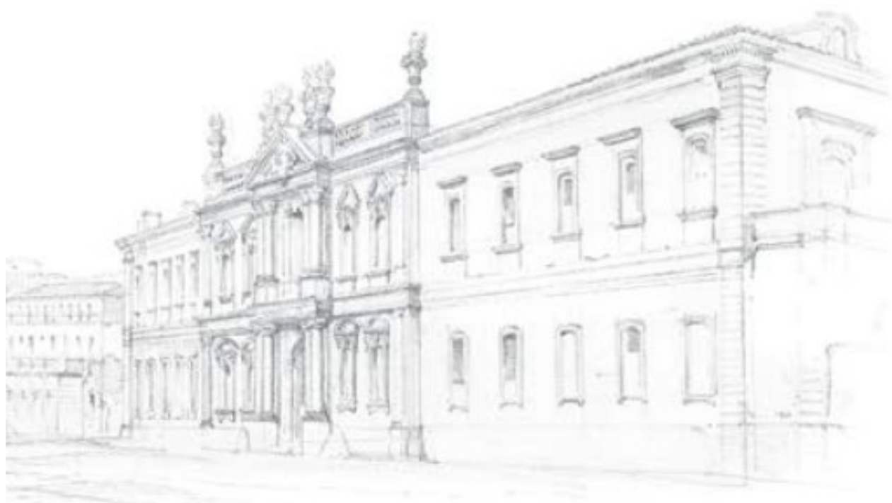
↑ Bonaventure Laurens, Façade de l'hôtel-Dieu de Carpentras, crayon, vers 1849

par l'ouverture de la bibliothèque musée dans son nouvel écrin, accueillant 42 989 visiteurs sur ses 236 jours d'activités, soit 4 777 personnes par mois. Également, 159 groupes, soit 2 741 personnes ont visité les collections permanentes et temporaires dont 116 en visites guidées. La bibliothèque accueille aujourd'hui près de 7 000 lecteurs actifs et plus de 130 000 usagers avaient franchi le seuil de la bibliothèque multimédia en 2023.