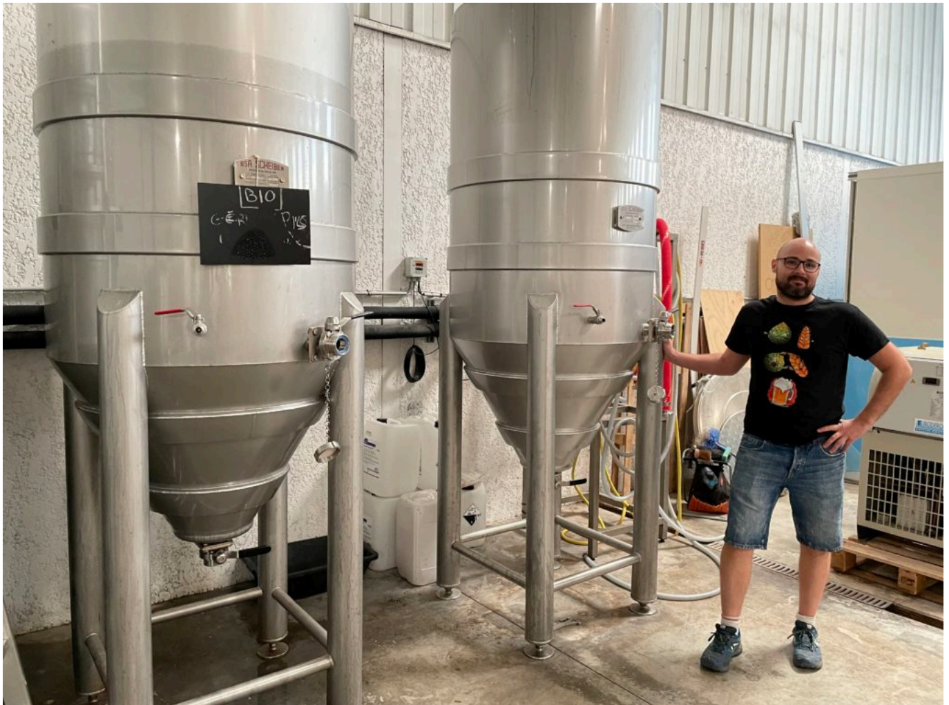
L'espace brasserie, outil de production de l'Imprévue parfois partagé avec d'autres brasseurs