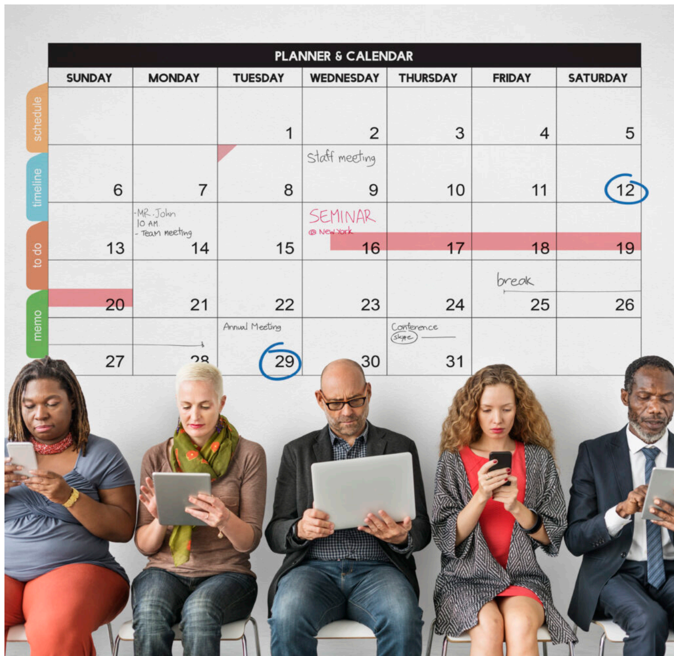
Calendar Planner Organization Management Remind Concept