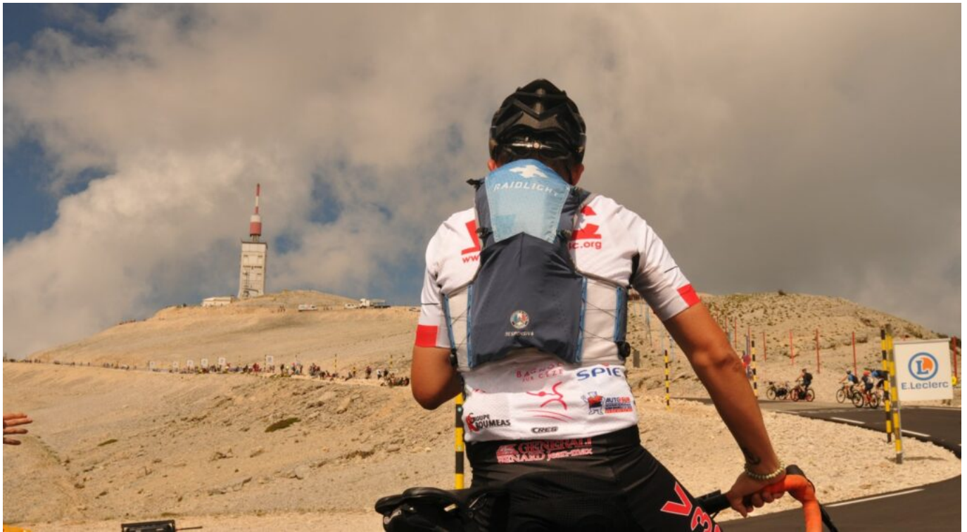
Cyclotouriste avant l'étape de 2021.

Ecrit par Laurent Garcia le 29 octobre 2024