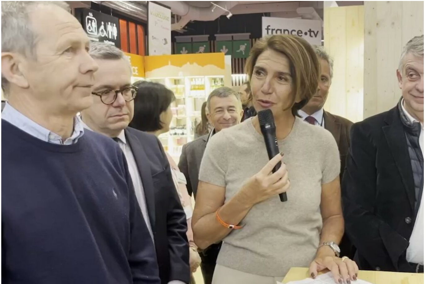
La présidente du Conseil départemental de Vaucluse.