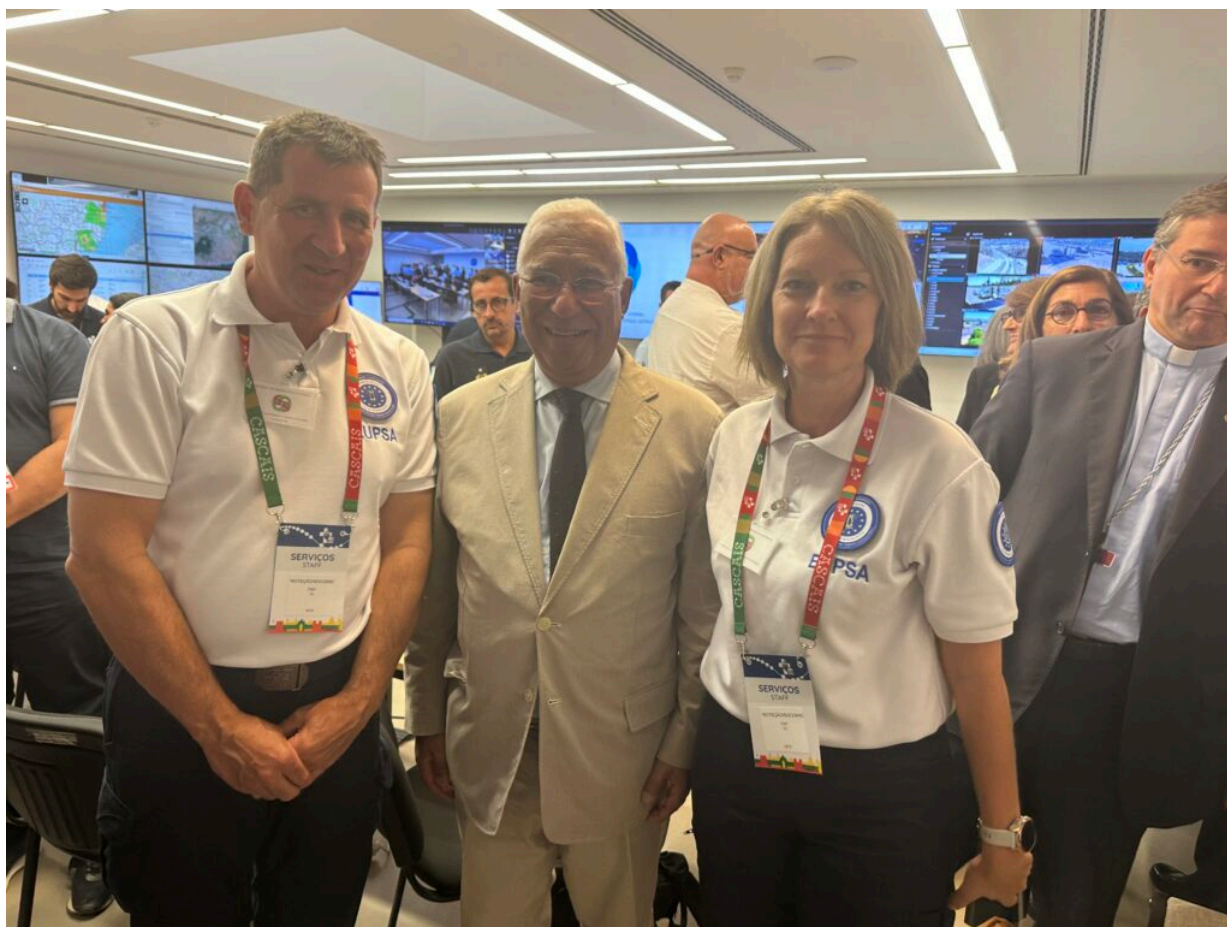
Caroline Boutin aux côtés du Premier ministre portugais António Costa aux JMJ.

Ecrit par Andrée Brunetti le 2 octobre 2023