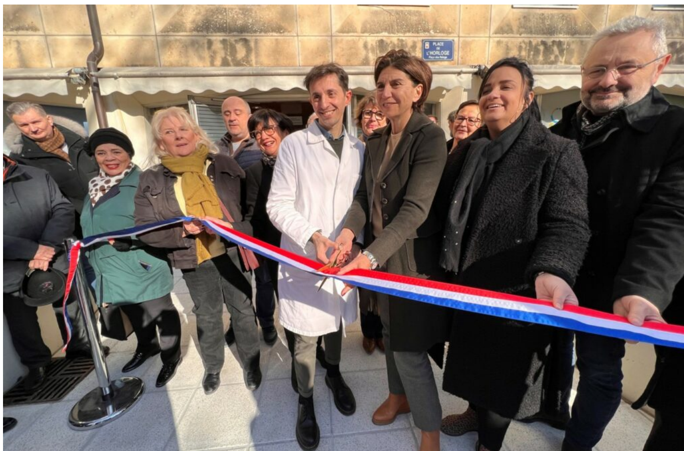
Inauguration de la maison de santé à Avignon en février dernier.