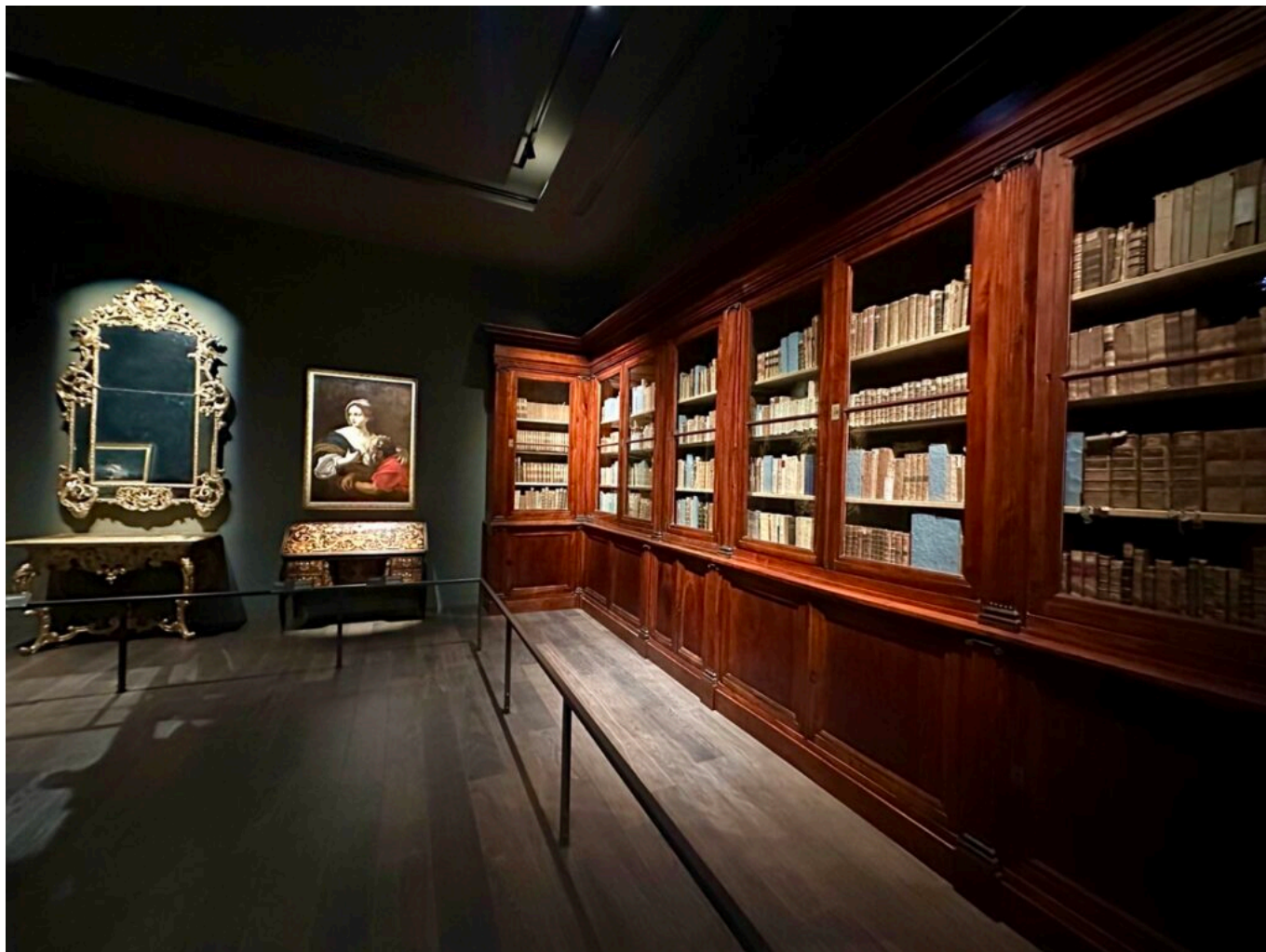
La bibliothèque de Barjavel