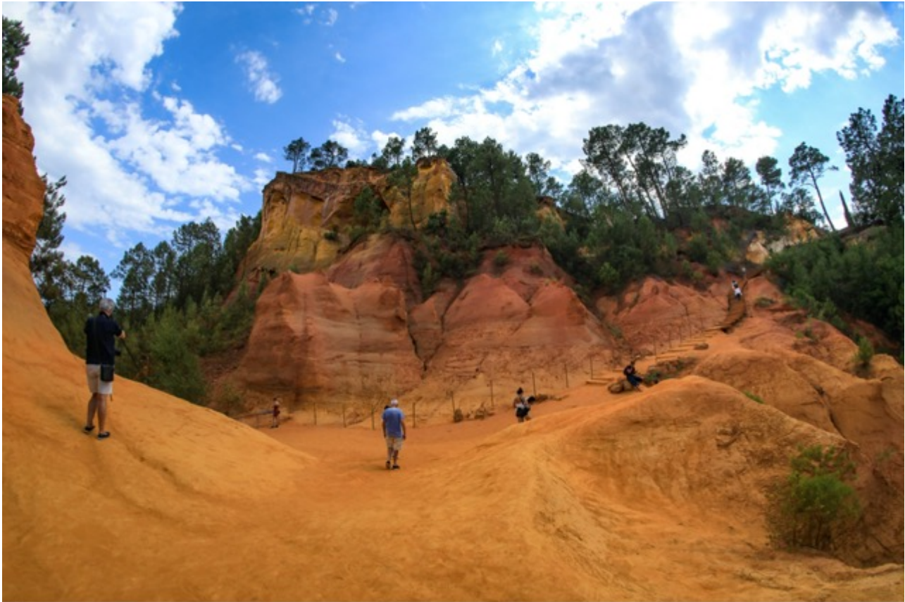
Le Sentier des ocres

Ecrit par Vanessa Arnal le 24 avril 2025