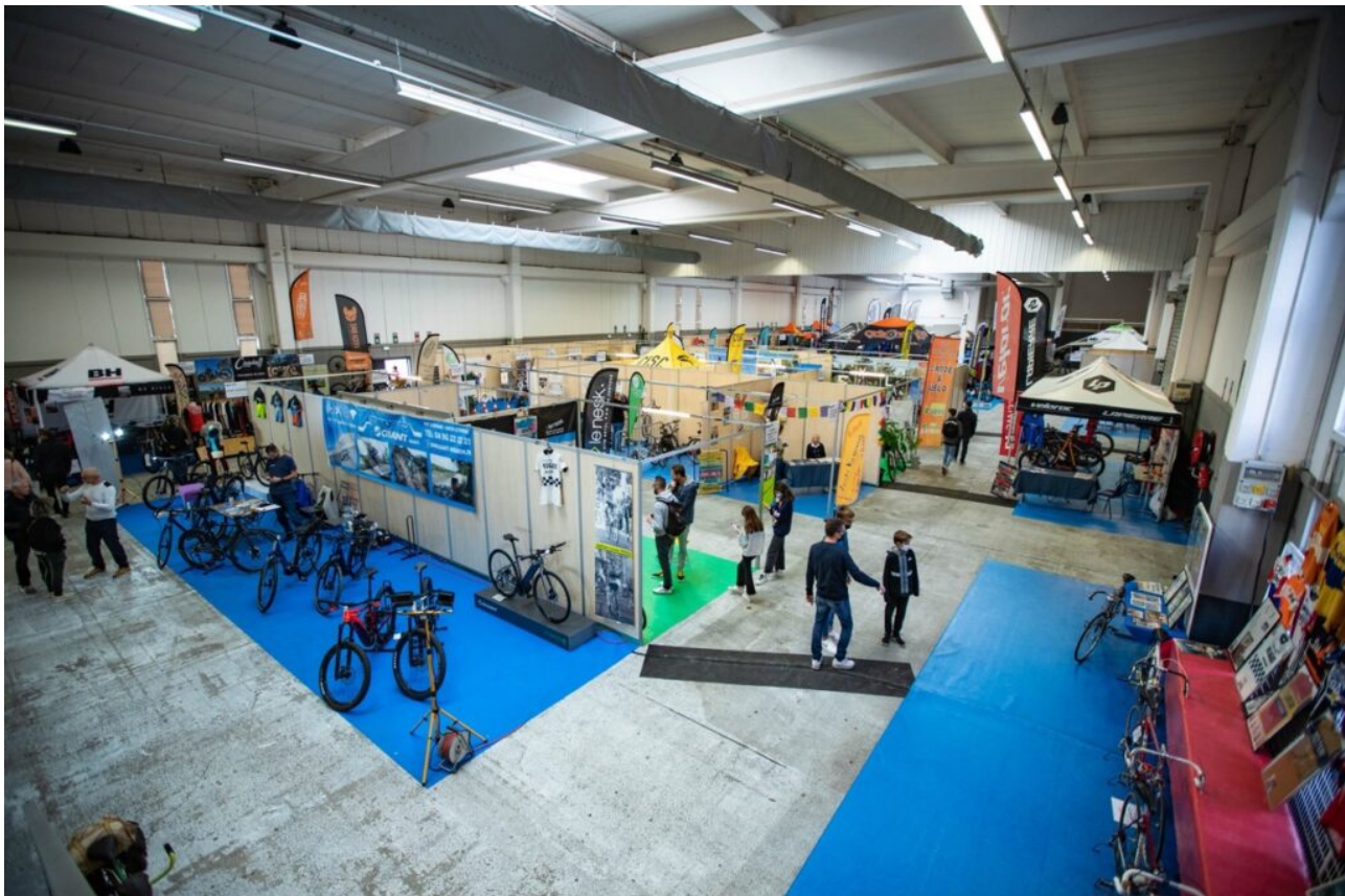
Le village des exposants.

Une piste d'essais de vélo et de matériel sera également installée, tout comme le coin de biathlon vélo et tir à la carabine qui est une nouveauté de la 6 e édition, les ateliers de réparation vélo et pour 'se remettre en selle'. Les visiteurs pourront aussi assister aux entraînements et compétitions et s'initier au Trial.