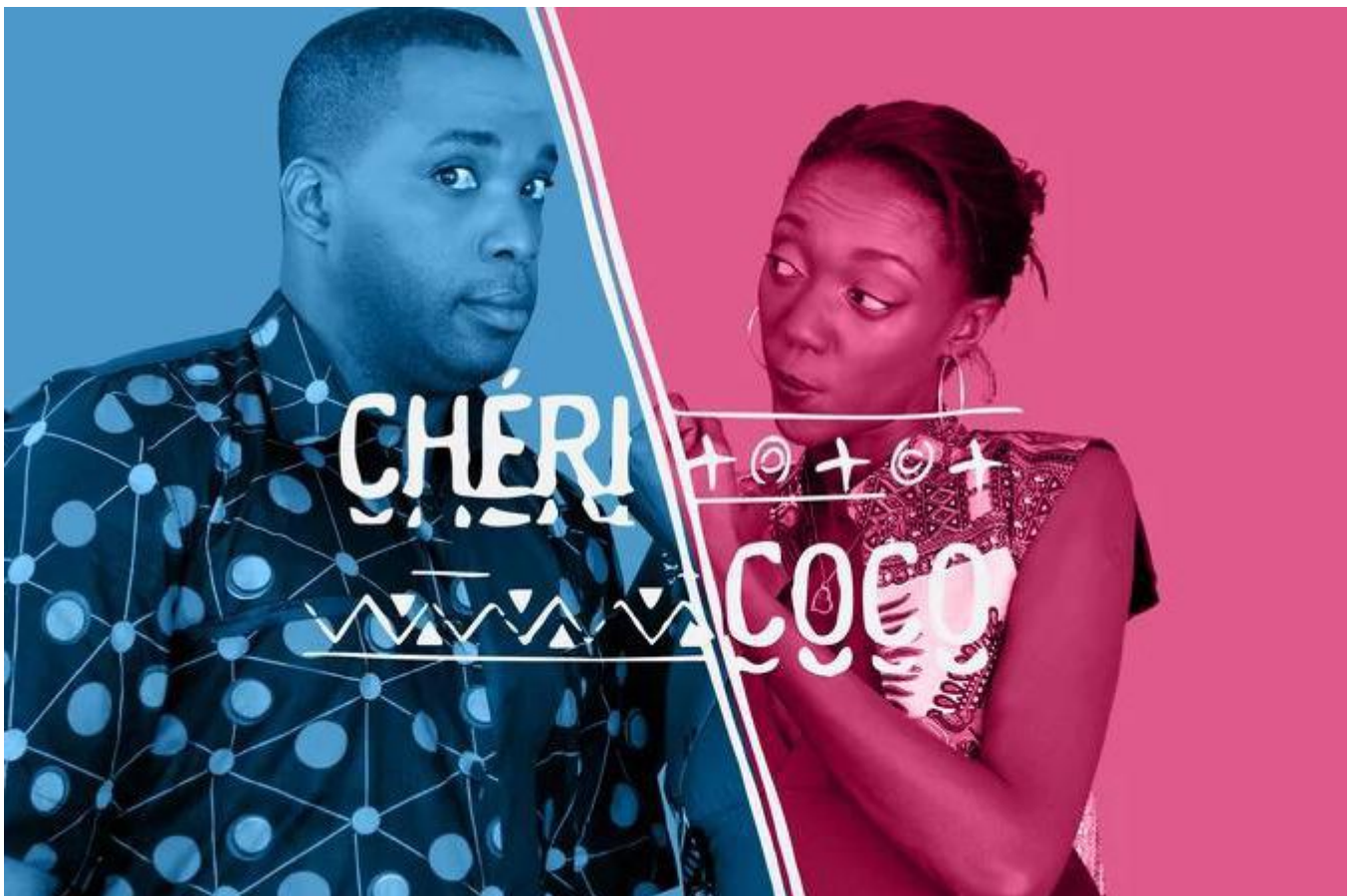
Série 'Chérie coco'.

Le succès est immédiat et populaire. Eu égard à la différence de culture, le pari était pourtant audacieux, « c'était délicat de montrer un couple dans son intimité, qui parle librement de tout. C'est rarement un programme que tout le monde regarde en famille ». Le deal ? Sortir de Dakar, montrer l'Afrique, la brousse, la réserve naturelle, la plage. Après deux saisons et 200 épisodes, le programme prend fin pour des raisons financières. Le souvenir, lui, demeure éternel.