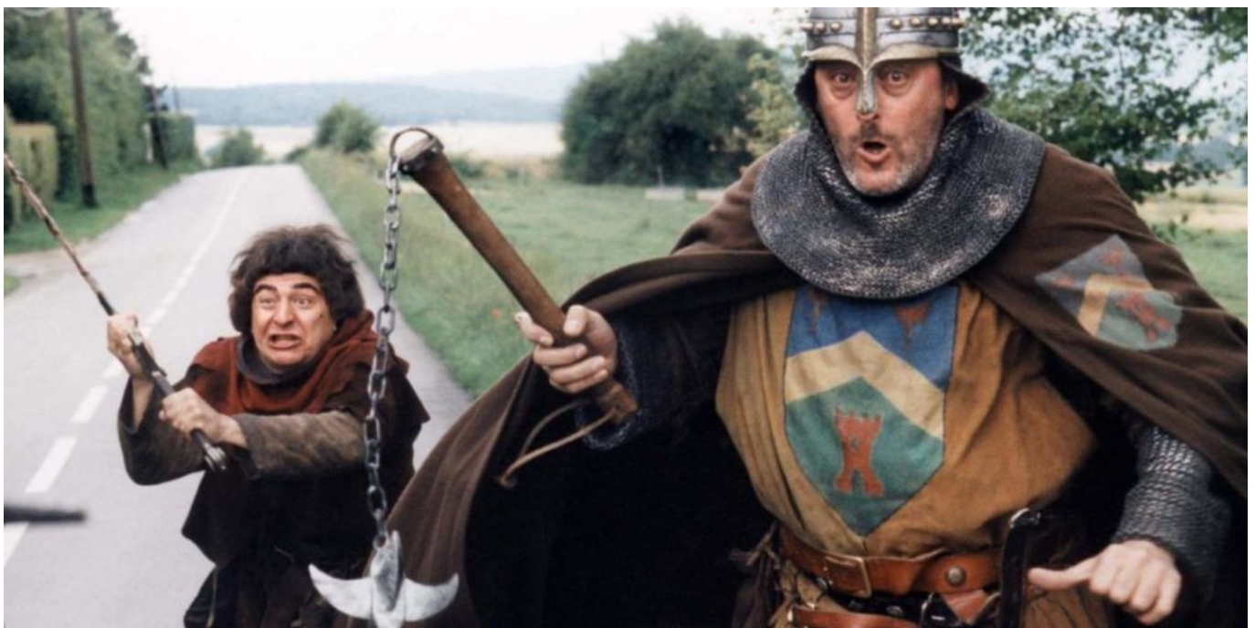
Christian Clavier et Jean Reno, ‘Les visiteurs’.