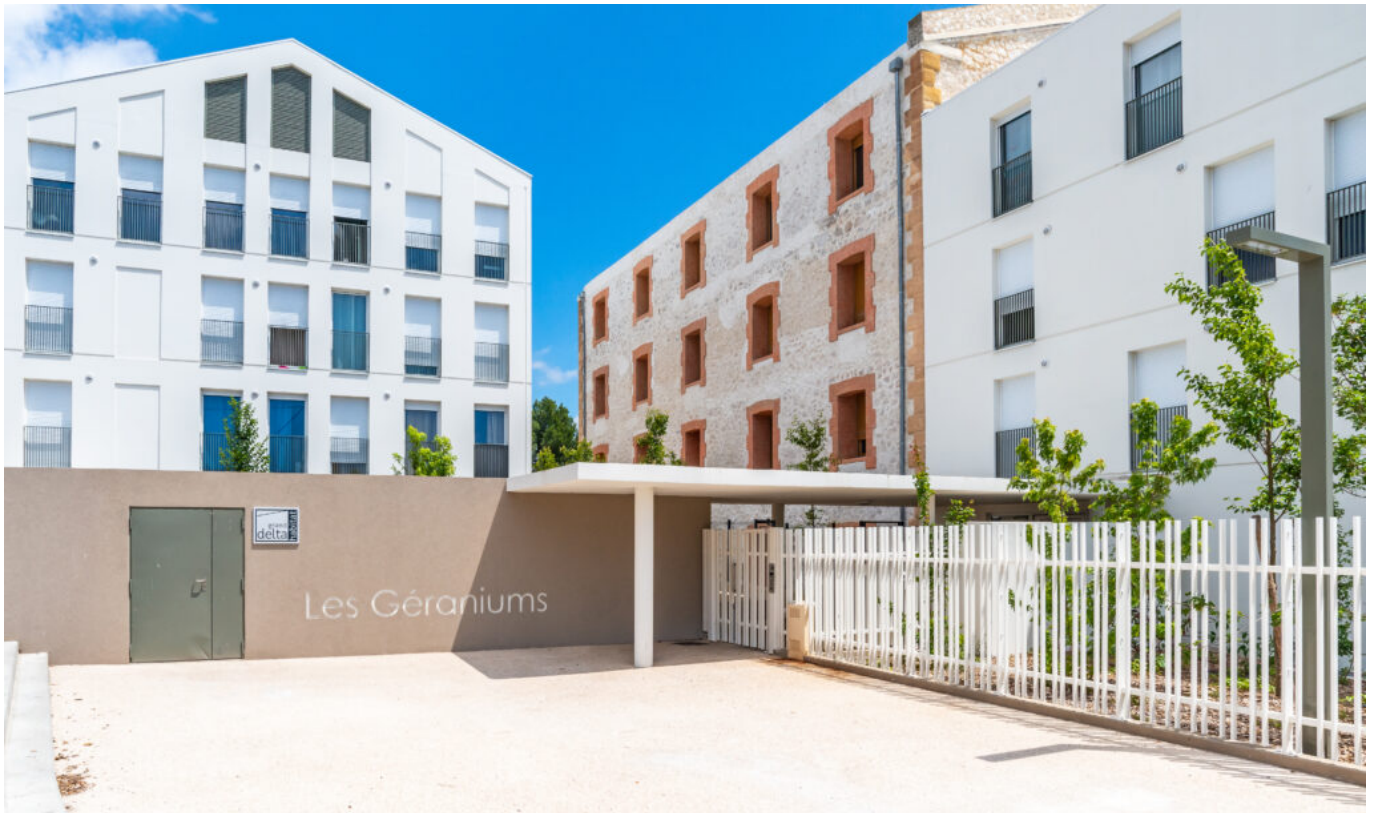
Les Gèraniums

Ecrit par Mireille Hurlin le 8 juillet 2024