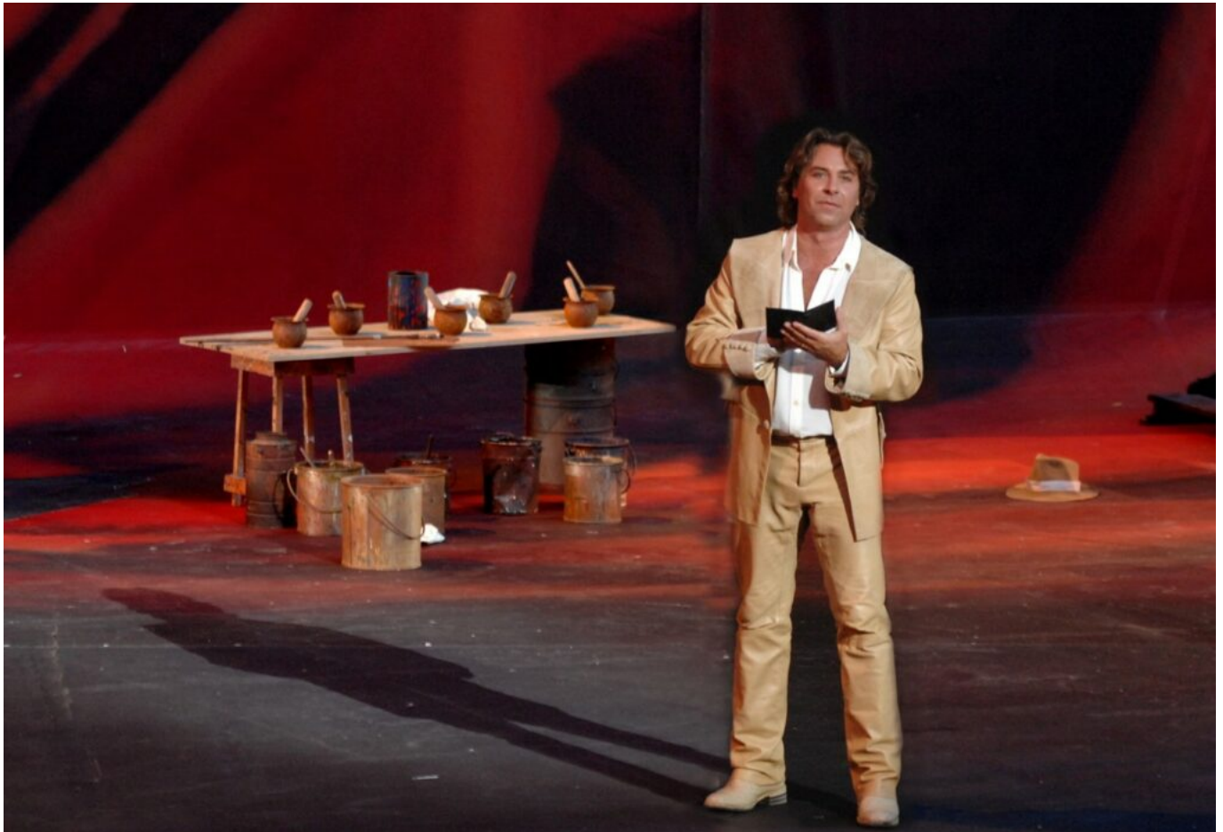
Roberto Alagna dans Tosca.

Que de tenors et baryton ont mis le feu aux gradins : Luciano Pavarotti, Plácido Domingo, José Carreras, Leo Nucci, José Van Dam, Ruggero Raimondi, Roberto Alagna, Rolando Villazón, Alain Fondary, Gabriel Bacquier, Vittorio Grigolo, Juan-Diego Flores, Giacomo Aragall, Jonas Kaufmann.