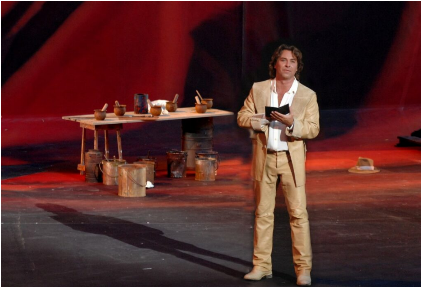
Roberto Alagna dans Tosca.

Que de tenors et baryton ont mis le feu aux gradins : Luciano Pavarotti, Plácido Domingo, José Carreras, Leo Nucci, José Van Dam, Ruggero Raimondi, Roberto Alagna, Rolando Villazon, Alain Fondary, Gabriel Bacquier, Vittorio Grigolo, Juan-Diego Flores, Giacomo Aragall, Jonas Kaufmann.