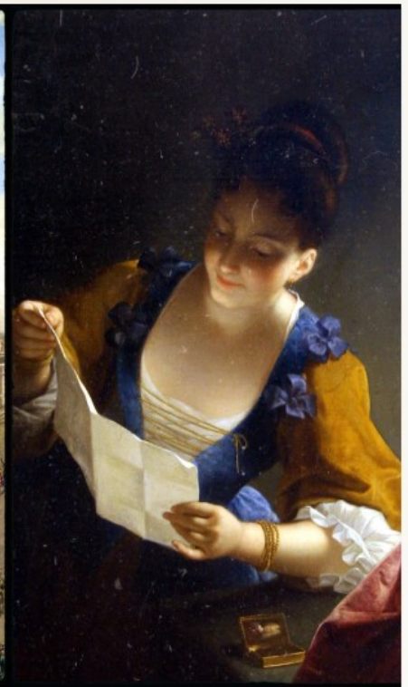
RAOUX J - Liseuse

La fondation Calvet a lancé son nouveau site Internet où elle déroule tous ses trésors. Il y a tout d'abord le Musée Calvet , puis le musée Lapidaire , les bibliothèques de la fondation Calvet, le muséum Requien , la bibliothèque Requien , le Musée du Petit Palais , le Médaillier Calvet , voilà pour Avignon et, enfin, le musée archéologique de l'Hôtel Dieu et le musée Jouve et juif Comtadin à Cavaillon.