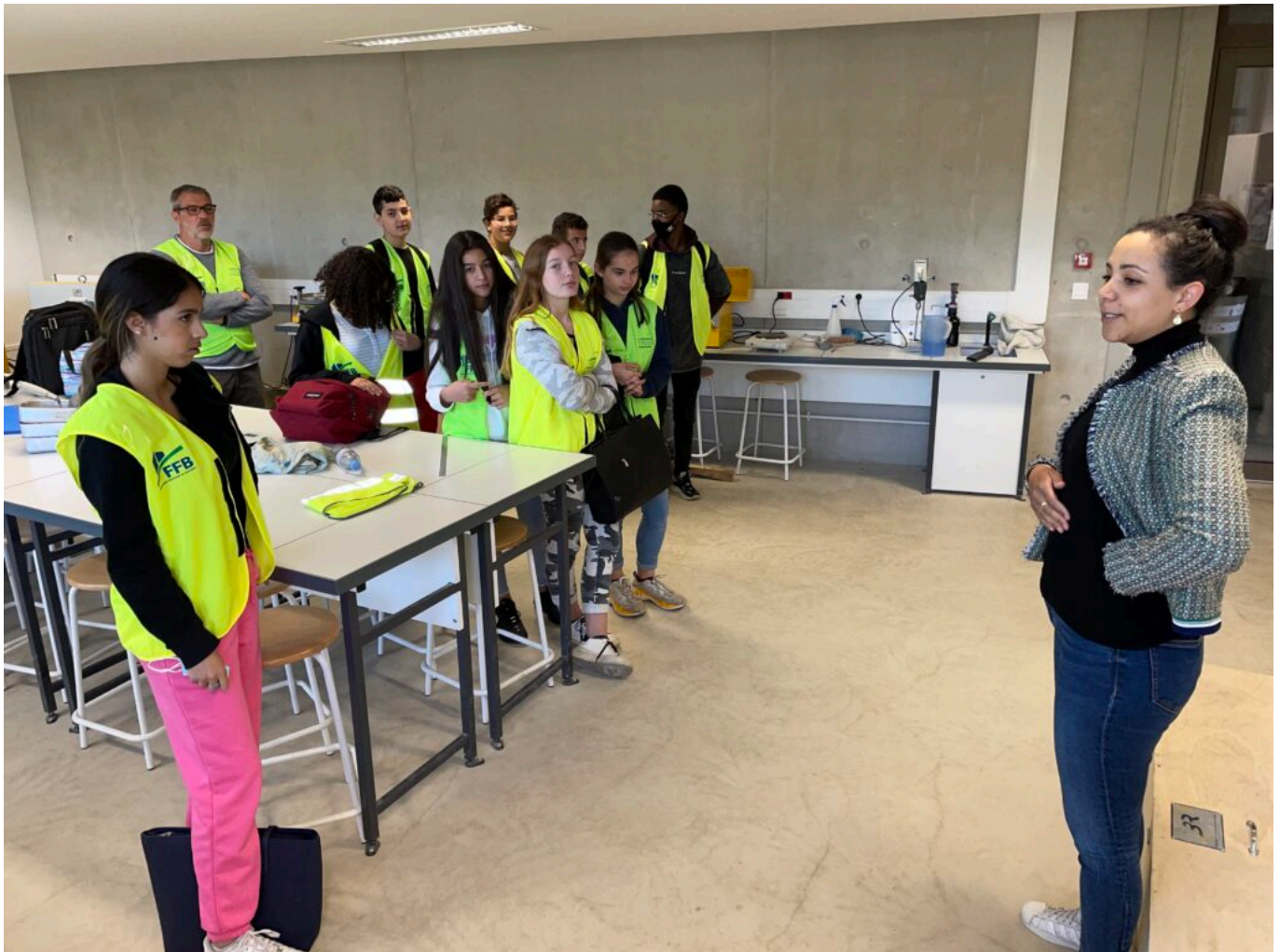
Présentation du laboratoire dévolu aux étudiants en licence et diplôme d'ingénieur

Ecrit par Mireille Hurlin le 27 avril 2022