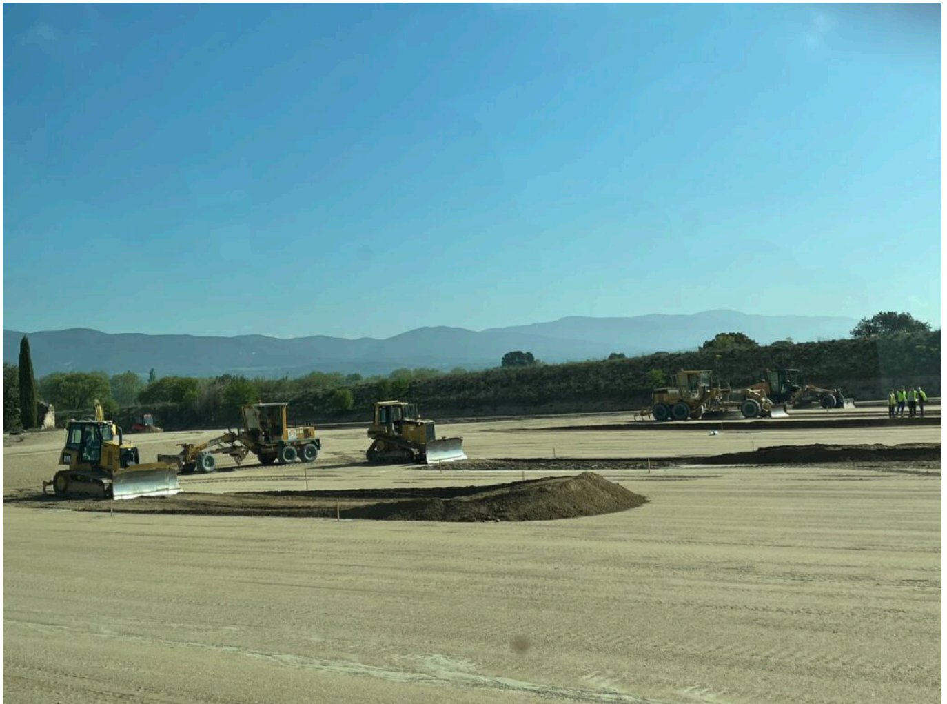
Exercices de terrassement

Ecrit par Mireille Hurlin le 27 avril 2022