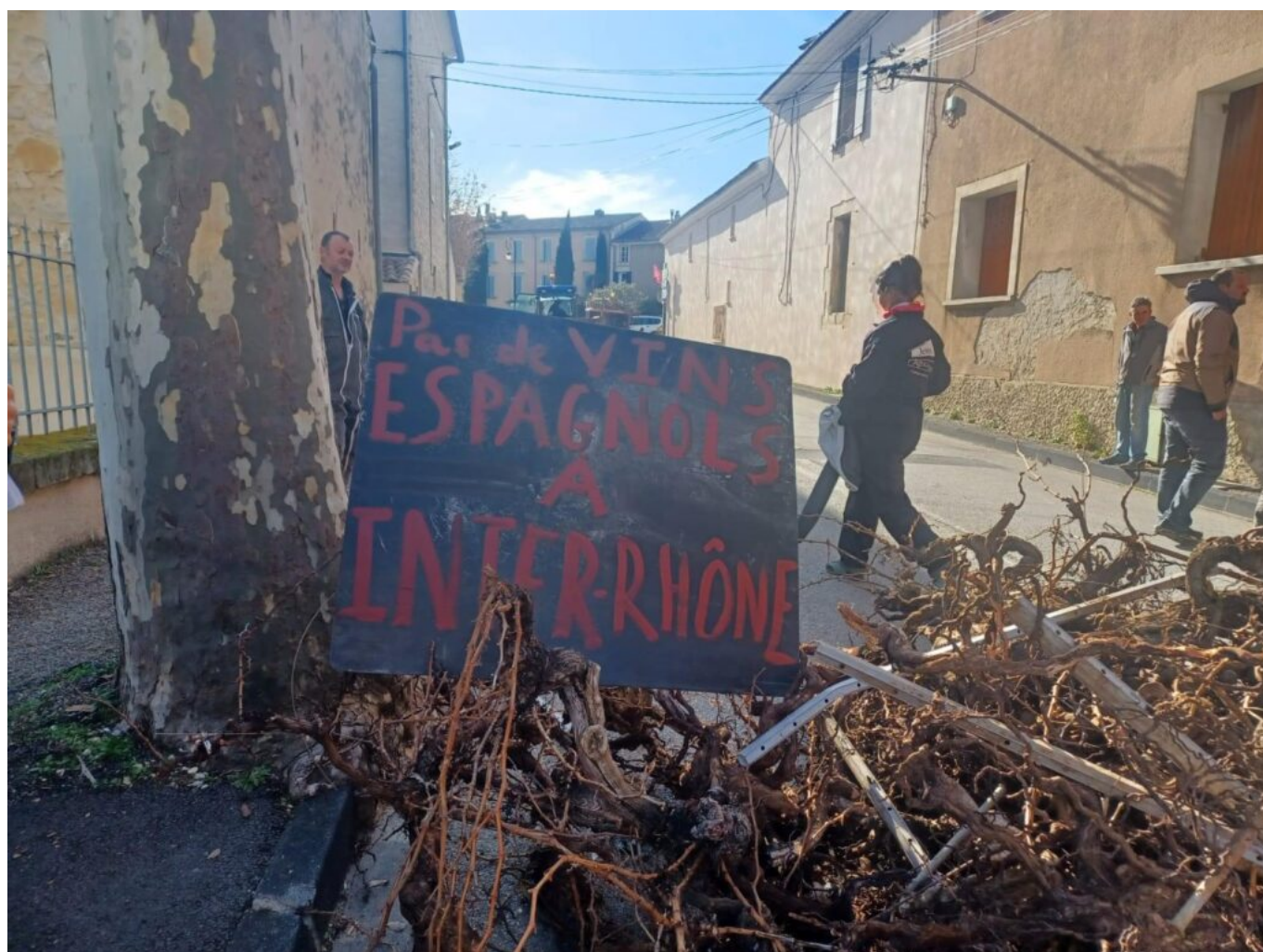
Manifestation à Sablet.

Le 25 novembre dernier, ce sont les viticulteurs qui ont défilé à Narbonne pour afficher leurs doléances face à la concurrence déloyale d'importation de vins produits par nos voisins européens qui, eux, n'ont pas à se plier à des injonctions de normes aussi drastiques que les nôtres. Au début de l'année, on a vu les Jeunes Agriculteurs retourner les panneaux de signalisation à l'entrée des villes et villages pour montrer qu'on marchait sur la tête. Mais personne, dans les hautes sphères, n'a fait attention à ces signaux d'alarme.