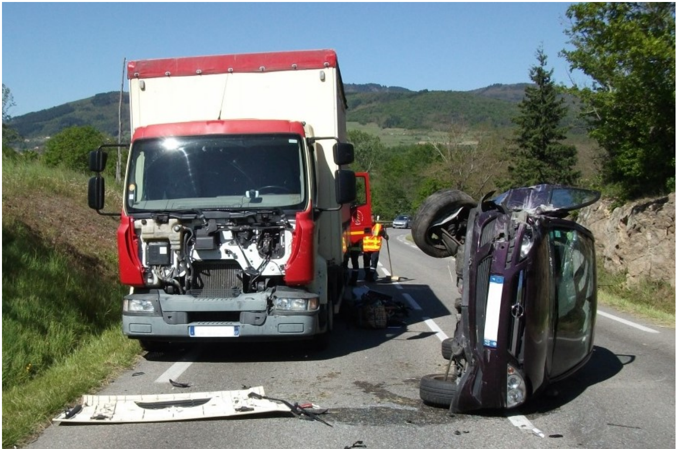
Image d'illustration.