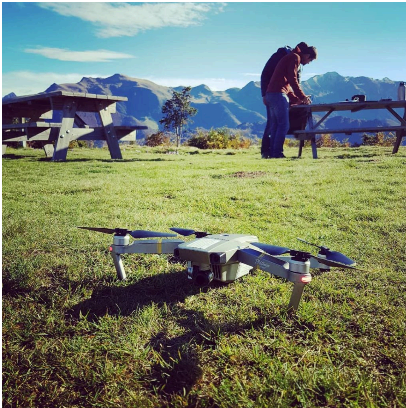
Formation Topographie et Inspection en Milieux Naturels par Drone.

Ecrit par Linda Mansouri le 30 mars 2022