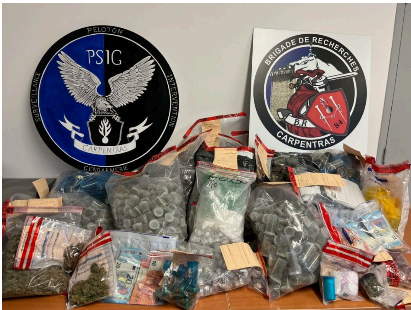
Saisie record en Vaucluse en 2023 pour les gendarmes, les douaniers et les policiers.

Par ailleurs en 2023 ce sont 5,625M€ (+92 %) d'avoirs criminels qui ont été saisis par la DIPN (Direction interdépartementale de la police nationale - anciennement DDSP) et plus de 5,46M€ par la gendarmerie (+91%). Au cours de l'année, 240 armes à feu ont été aussi saisies par la gendarmerie (+83%) et 90 par la DIPN (+34,3%). Des saisies d'armes (où figure une trentaine d'arme de guerres de type 'kalachnikov' ou 'Uzi') souvent en lien avec les trafics de stupéfiants, mais également dans d'autres cadres tels que les interventions pour violences intra-familiales.