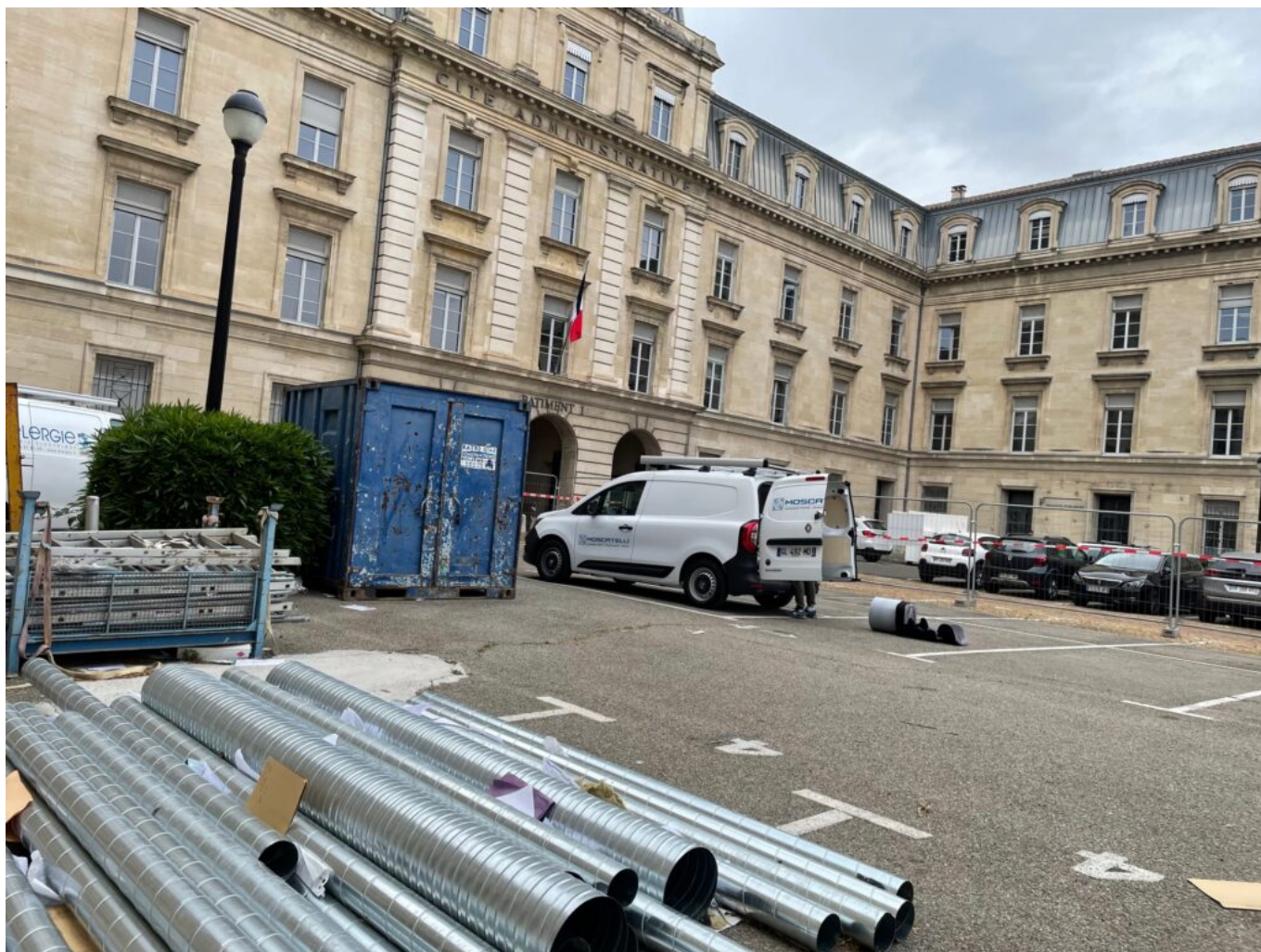
Le parking accueille véhicules d'entreprise, matériaux et bennes

Le restaurant sera transféré au rez-de-chaussée et à l'entresol du bâtiment 3. Des ouvertures seront réalisées dans la dalle de l'entresol afin de créer des salles de restauration en mezzanine et apporter plus de lumière naturelle aux salles de restauration en rez-de-chaussée. Le restaurant comptera 200 places assises permettant de servir 600 repas au gré de trois services. La cuisine reste inchangée mais un accès sera réalisé pour conduire à la chaîne de distribution à l'angle sud du rez-de-chaussée du bâtiment. Durant les travaux, qui devraient s'étendre entre 4 et 6 mois, le restaurant restera fermé. Enfin, une terrasse sera aménagée contre la façade sud du bâtiment.