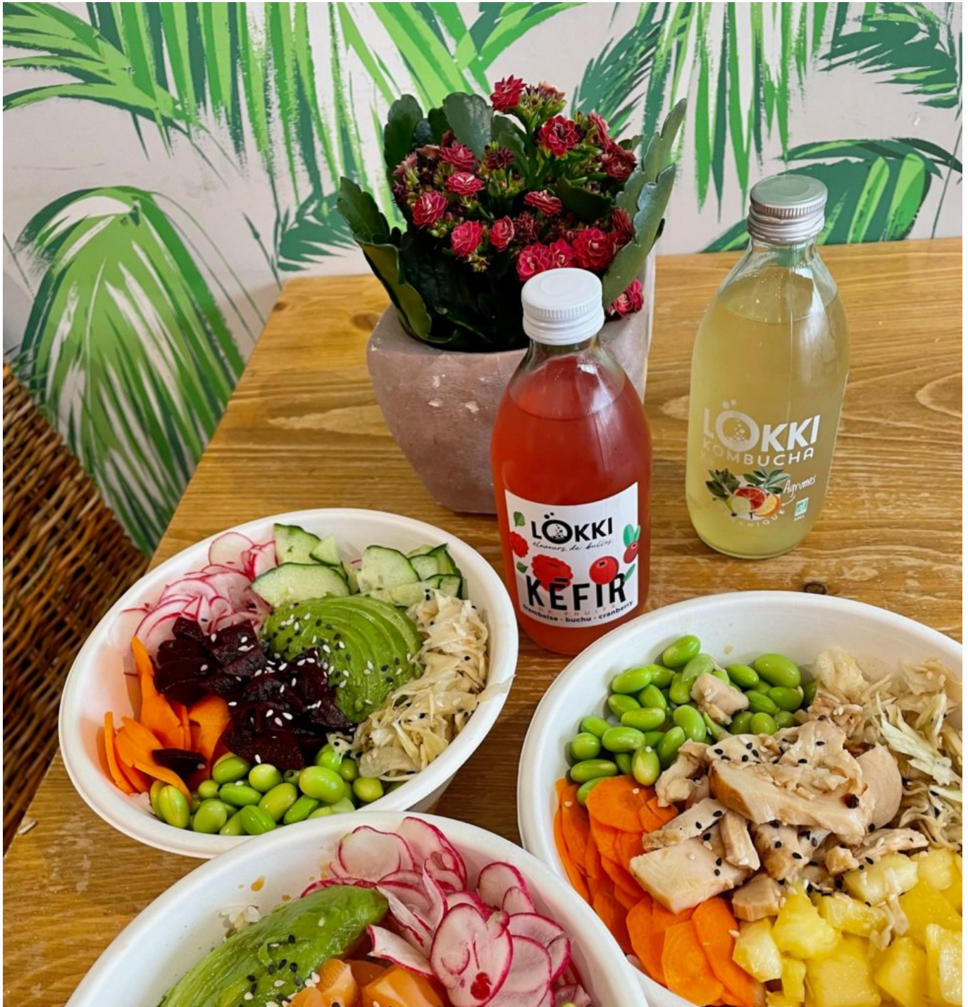
On en salive...

mille, la politique RSE de l'entreprise !