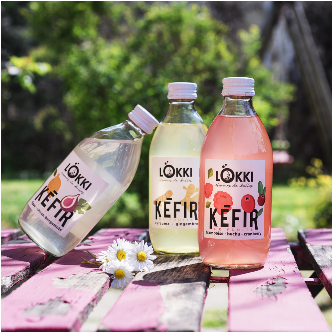
Trois teintes de kéfirs.

Ecrit par Linda Mansouri le 21 septembre 2021