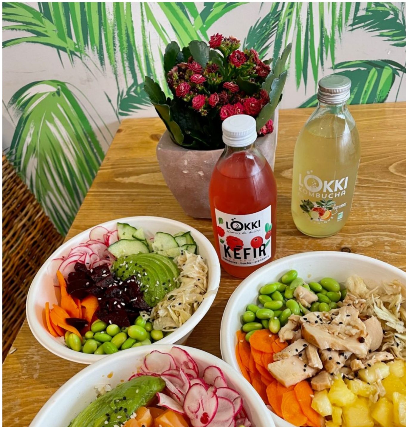
On en salive...

mille, la politique RSE de l'entreprise !