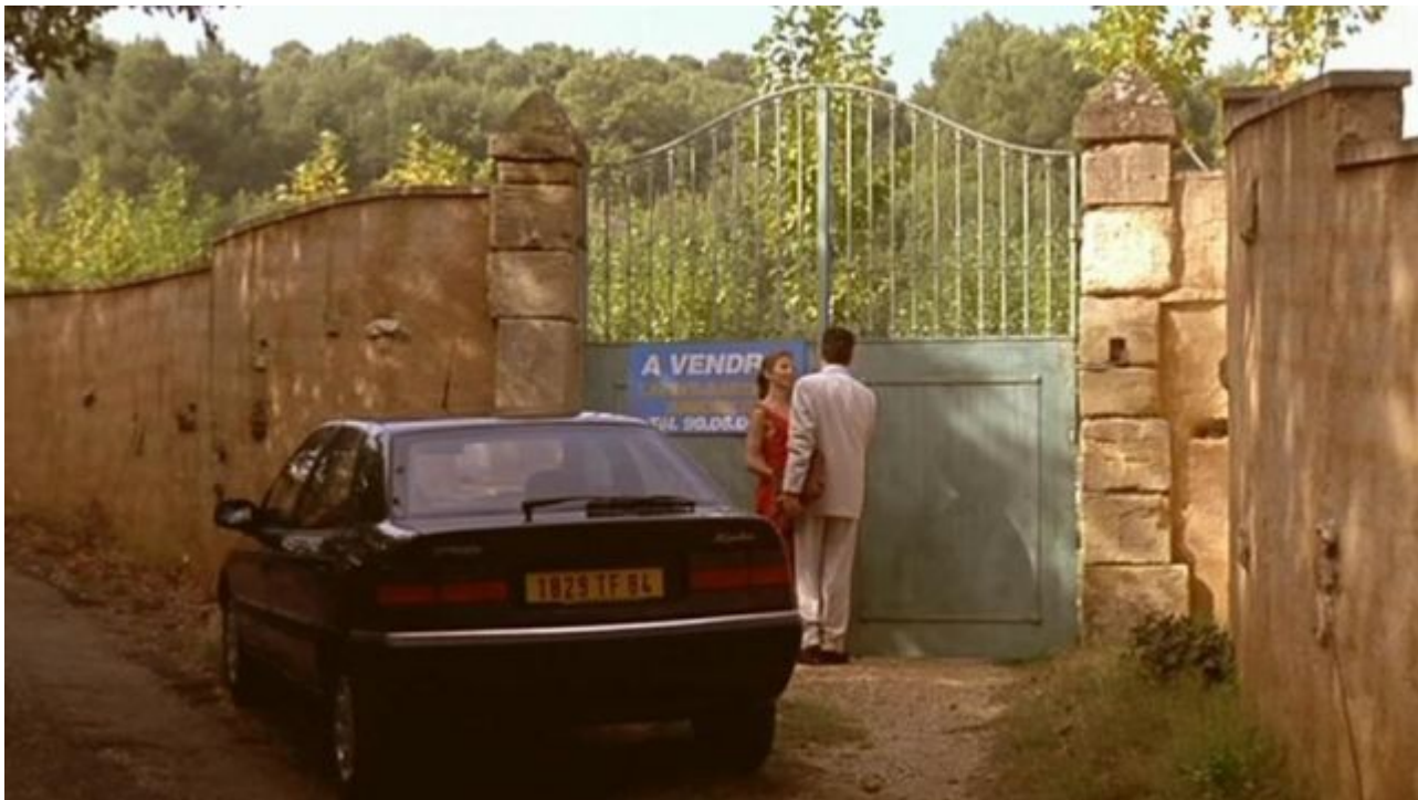
Le village d'Oppède-le-Vieux dans 'Gazon Maudit' avec Alain Chabat (1995)

« Nous devons intégrer le savoir américain tout en l'adaptant à la réalité du modèle français. D'où l'intérêt de fabriquer des programmes d'enseignement commun et de les étendre via les campus physiques ou numériques. Les enseignants et les personnes issues du métier sont légion dans le Vaucluse ou les départements limitrophes. »