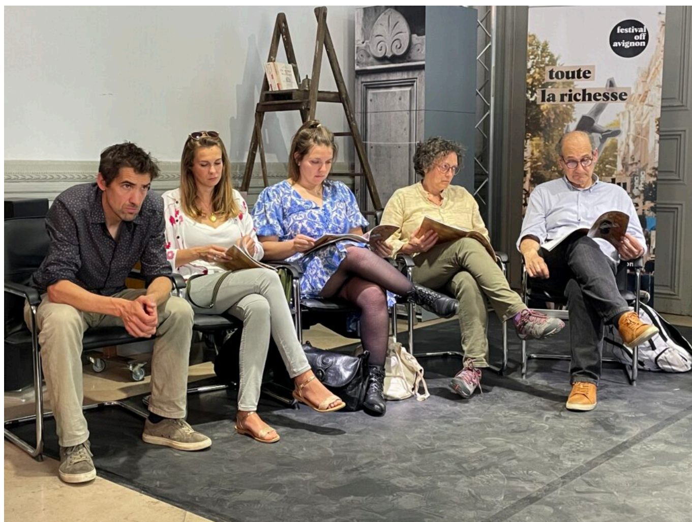
Des membres du Conseil d'administration

Ecrit par Mireille Hurlin le 25 mai 2023