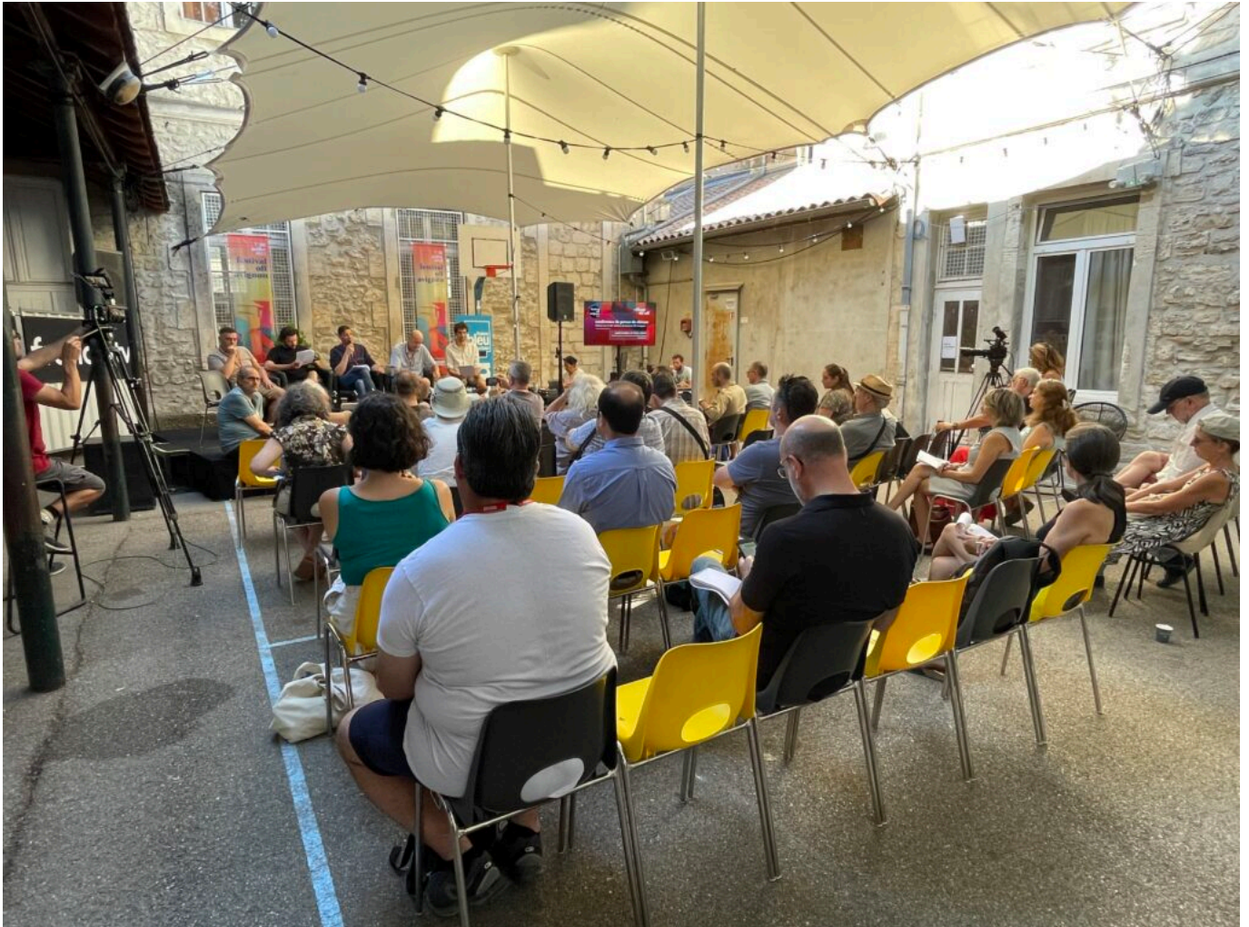
La conférence de presse au Village du off lors du pré-bilan du Festival off d'Avignon

Ecrit par Mireille Hurlin le 3 août 2022