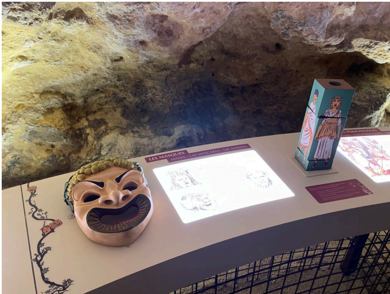
Le génie romain pour le théâtre, le plus souvent de comédies

Ecrit par Mireille Hurlin le 26 octobre 2022