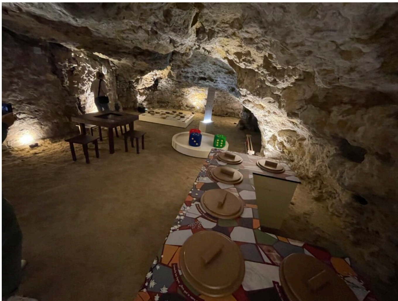
Se restaurer, jouer... en famille entre amis DR MH

La salle fait la part belle au génie romain reconnu dans le domaine, au combien essentiel, de l'hydraulique. Aménagement des territoires, approvisionnement en eau, aqueducs, thermalisme, les ingénieurs romains ont fait partie des maitres fondateurs de l'empire. Maquette tactile et animations nous permettent d'approcher ces génies-trouve-tout : avec eux, on expérimente, on observe, on comprend l'innovation.