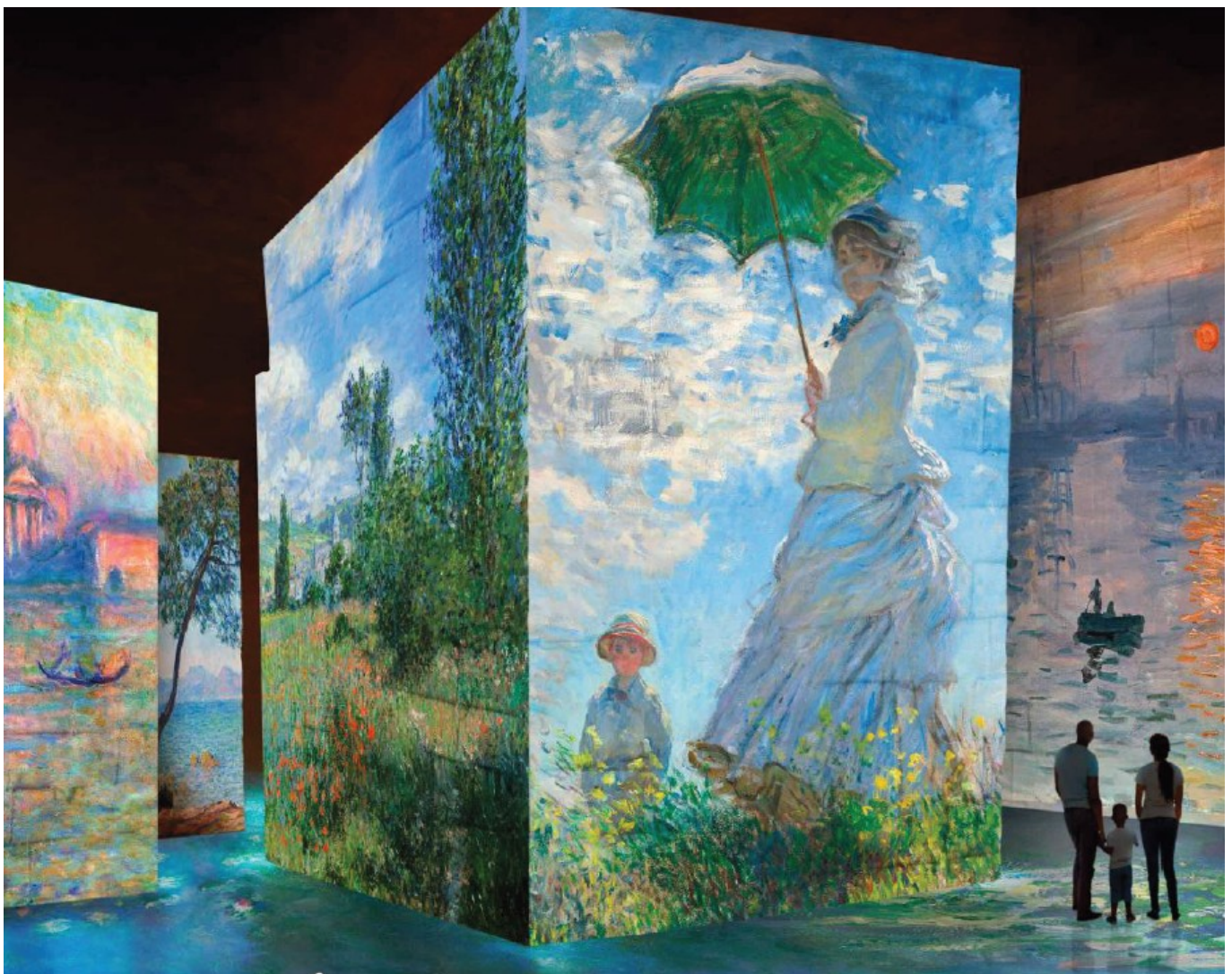
Oeuvres de Claude Monet

Direction artistique : Nicolas Charlin / Mise en scène et animation : Cutback / Supervision musicale et mixage : Start-Rec / Production : Culturespaces Studio®