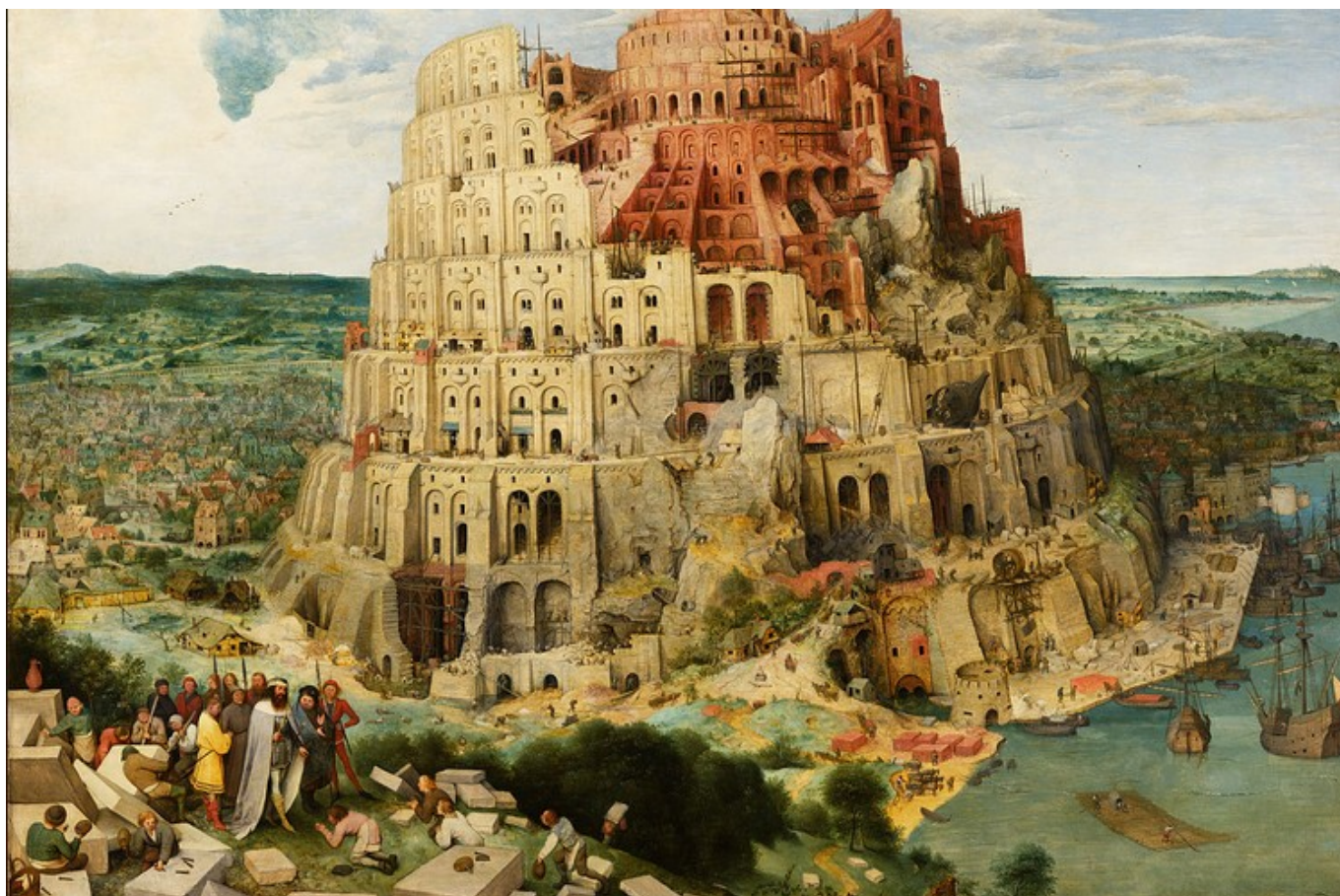
La tour de Babel