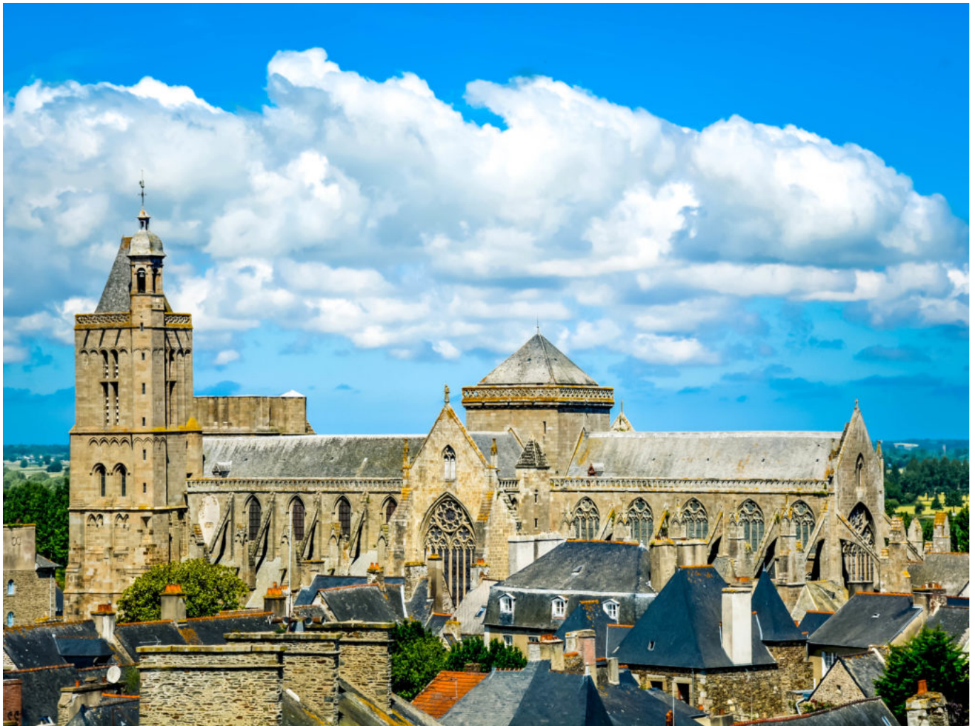
Cathédrale de Dol-de-Bretagne