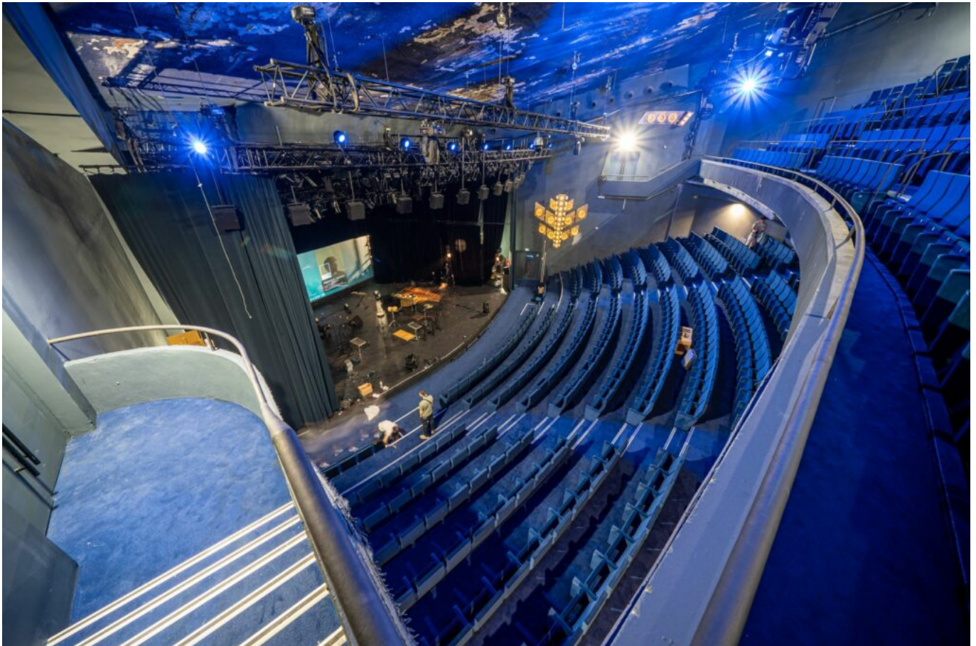
La Scala Provence

De 12 à 35€. La Scala Provence. 3 rue Pourquery Boisserin. 04 65 00 00 90. billetterie@lascal-provence.fr