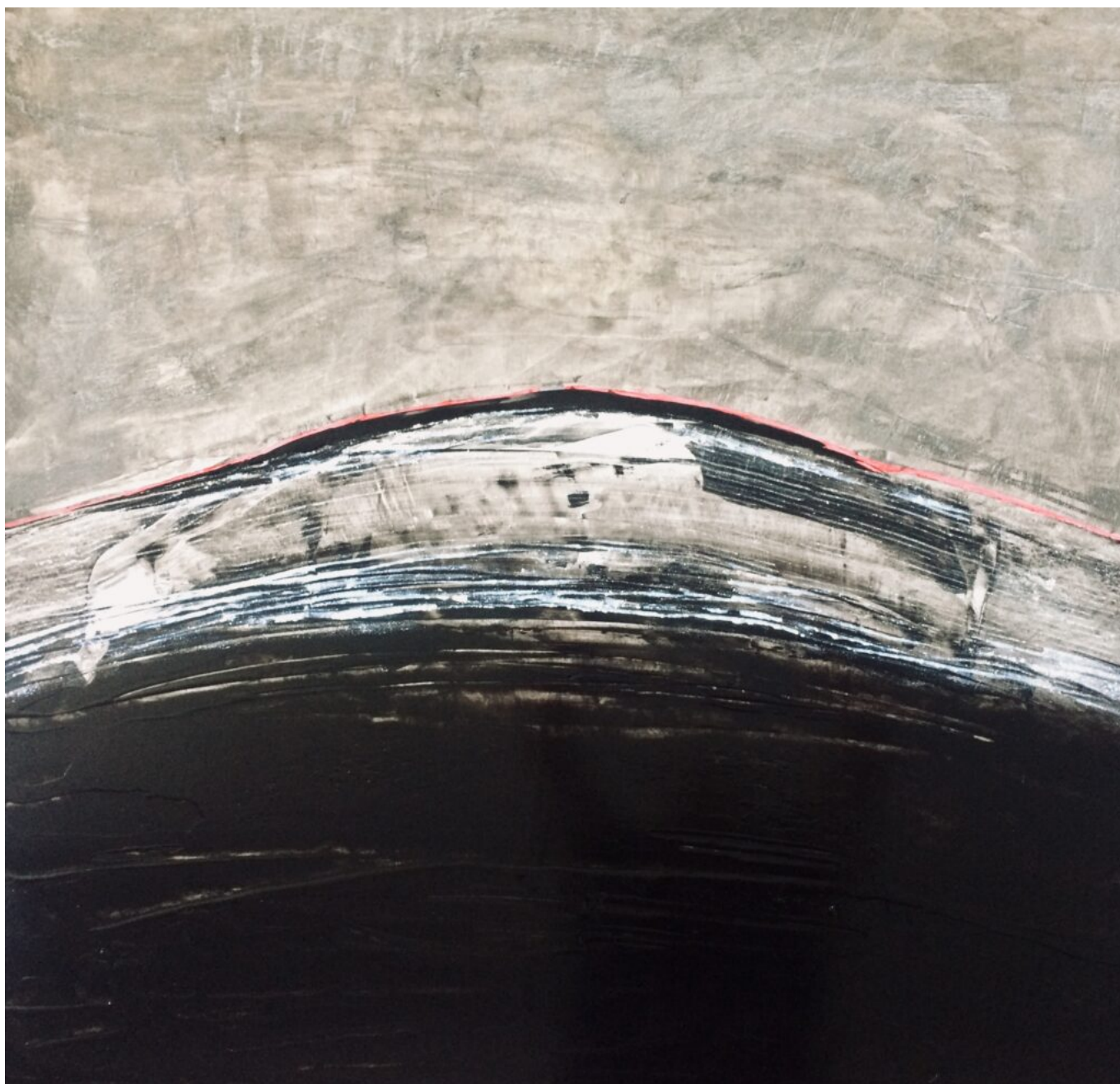
Autoclave I (90X90) © Yvan Magnani