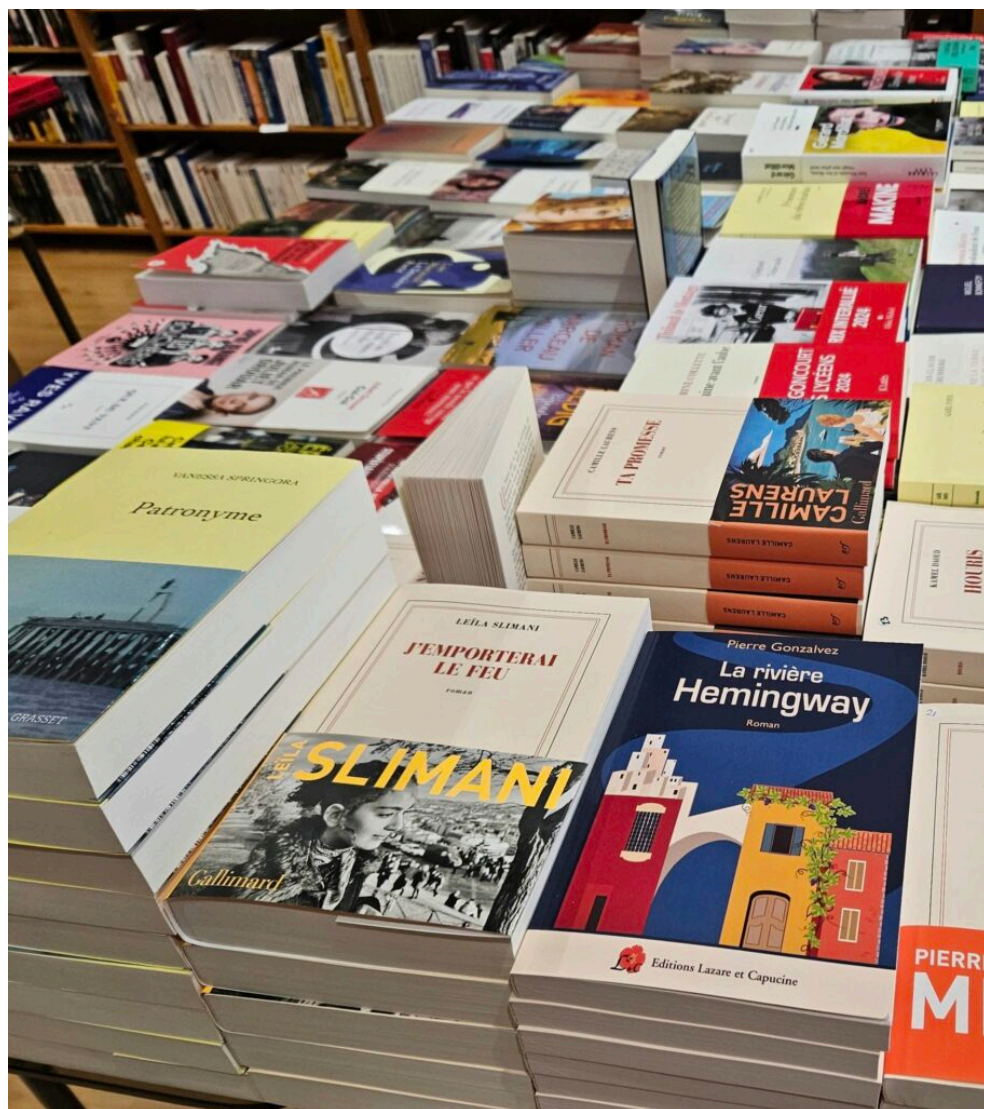
La rivière Hemingway est en librairie depuis le 11 mars dernier.

Ecrit par Laurent Garcia le 18 mars 2025