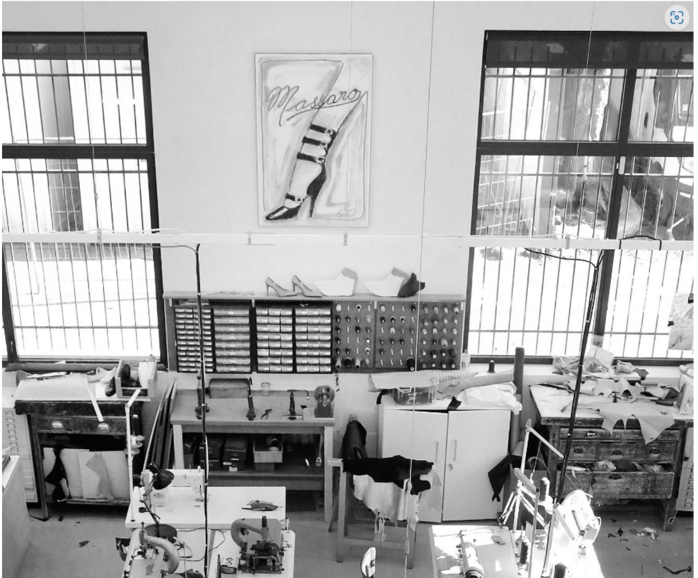
DR Les ateliers Massaro

Musée Angladon ici . Du mardi au dimanche. De 13h à 18h. Toutes les infos pratiques ici et ici . 15€. MH