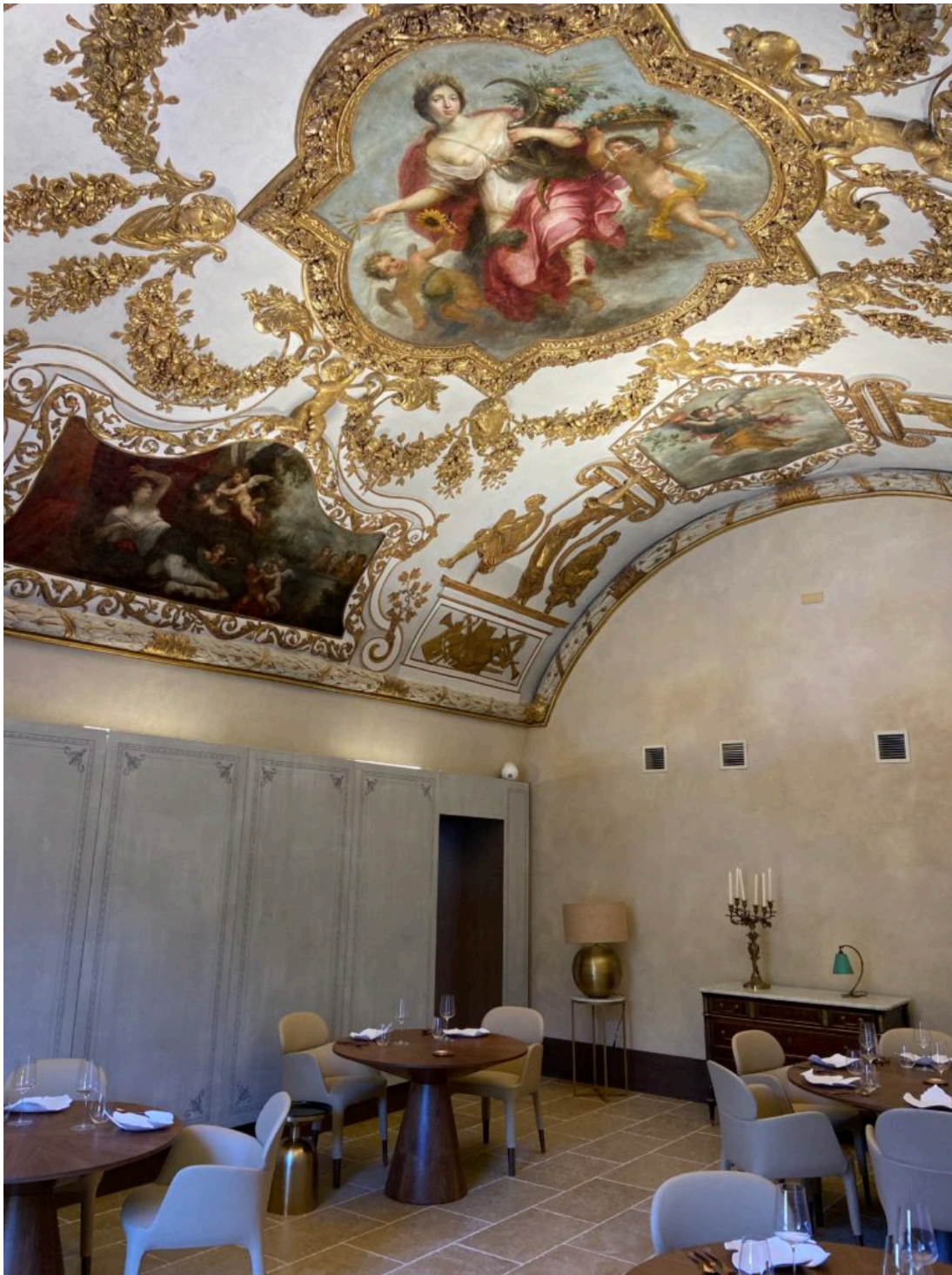
Le plafond baroque du restaurant gastronomique.

Ecrit par Echo du Mardi le 26 juillet 2021