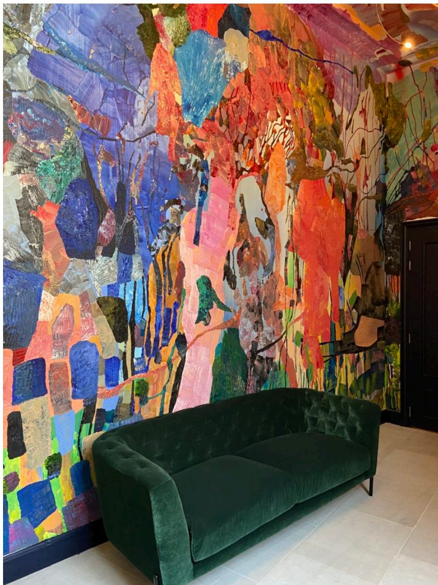
Le vestibule revisité par Olympe Racana-Weiler.

Lady pomme d'amour. Posées sur la corniche, des piles de pommes sculptées sont une grande tentation pour de petits animaux : écureuils, pigeons, colombes... Son œuvre cohabite harmonieusement et joyeusement avec les bustes des César.