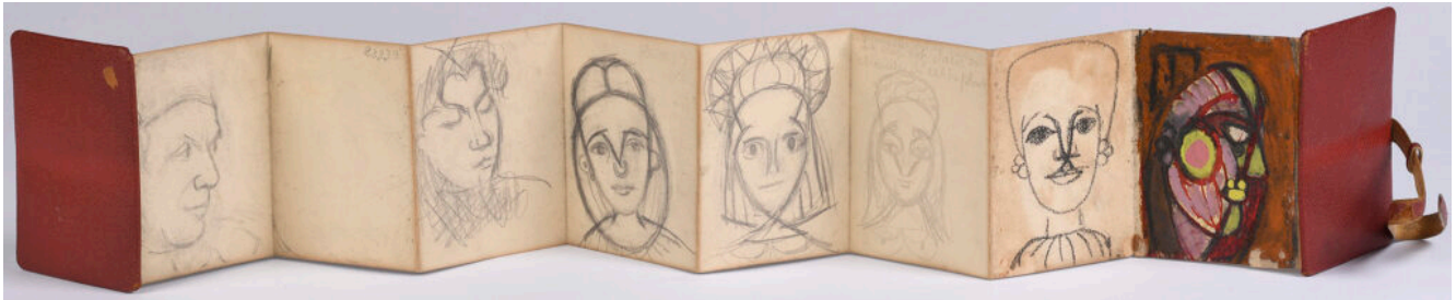
Un carnet de Dora Maar