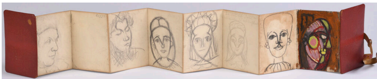
Un carnet de Dora Maar