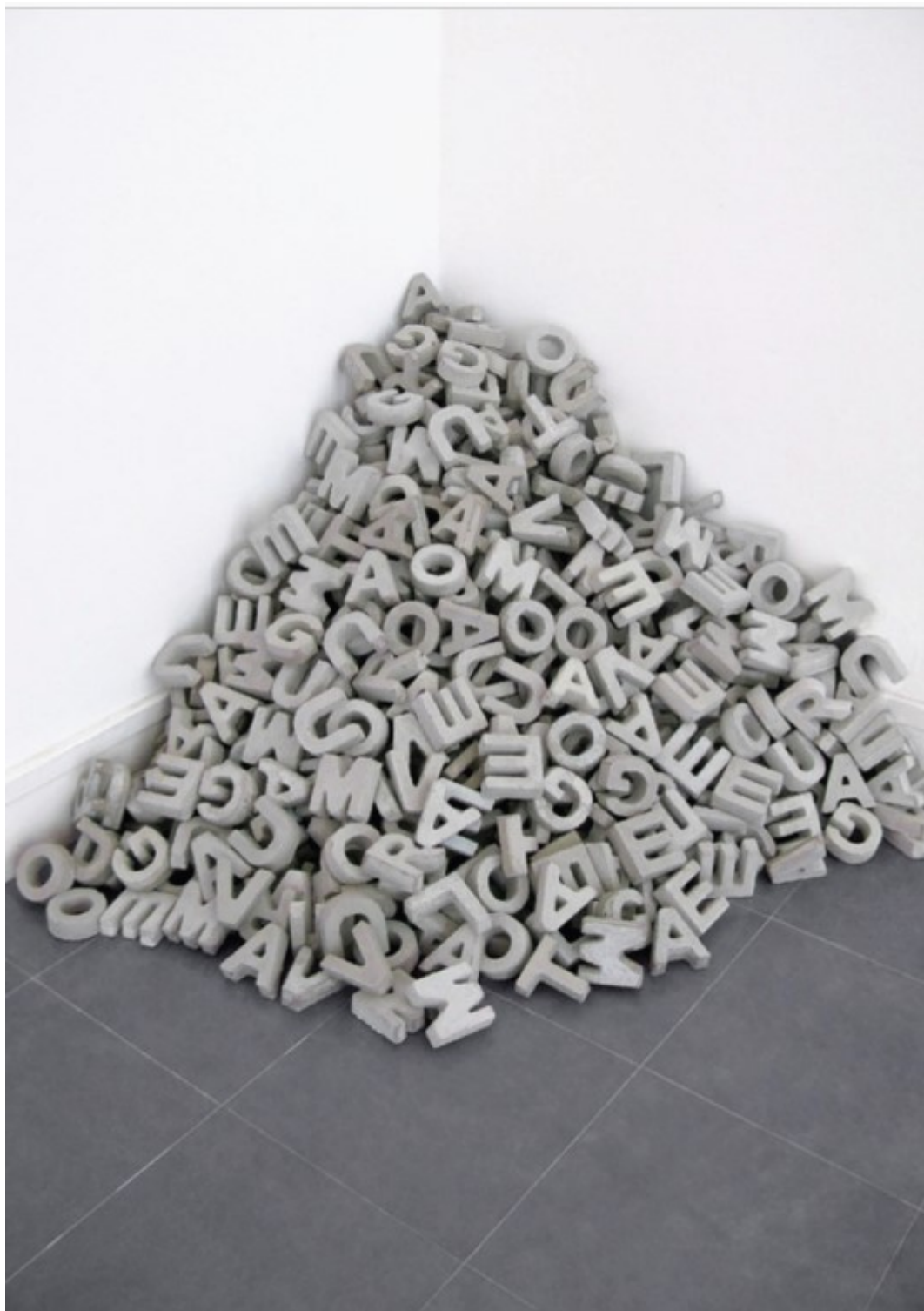
Les lettres en béton, installation