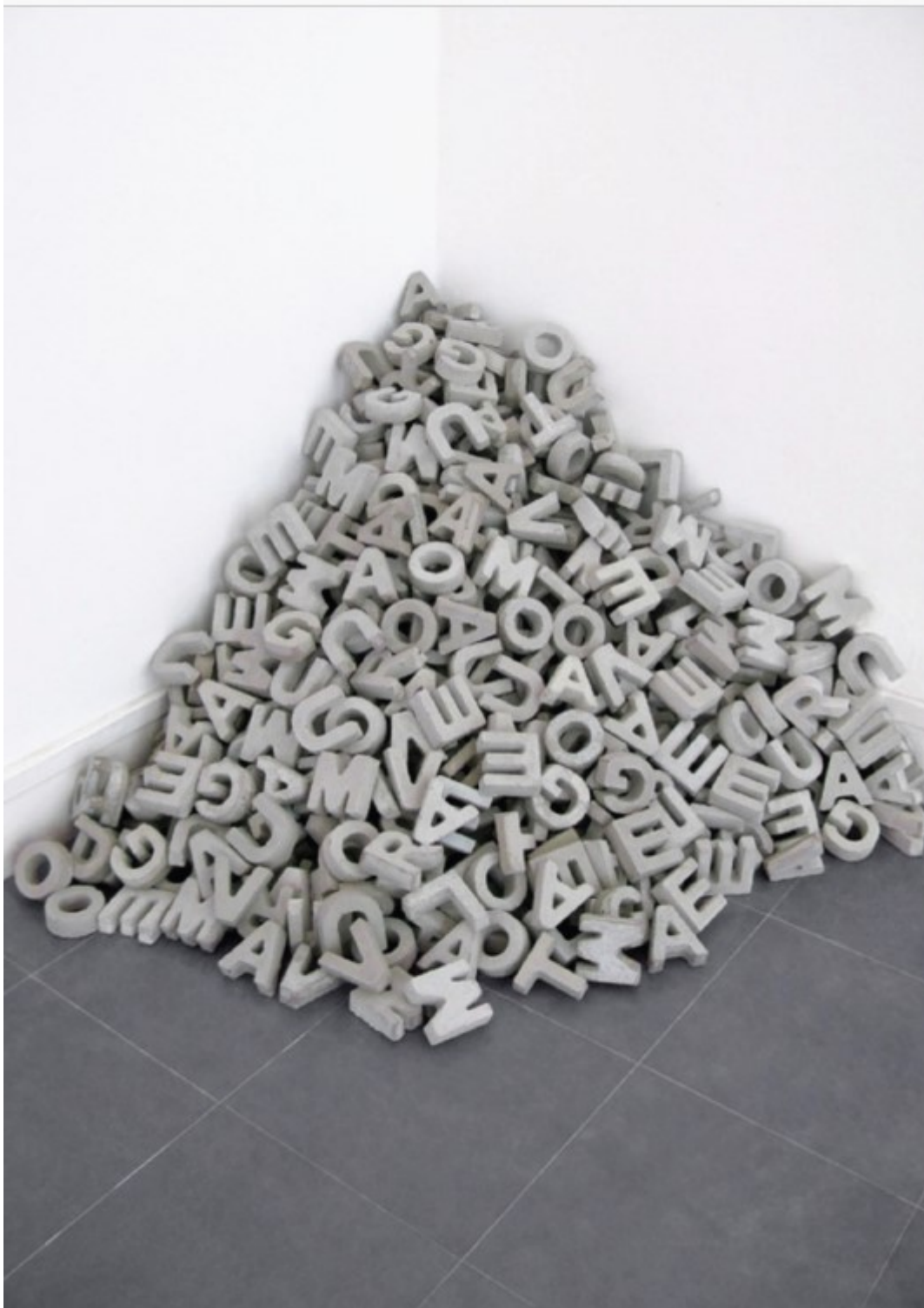
Les lettres en béton, installation