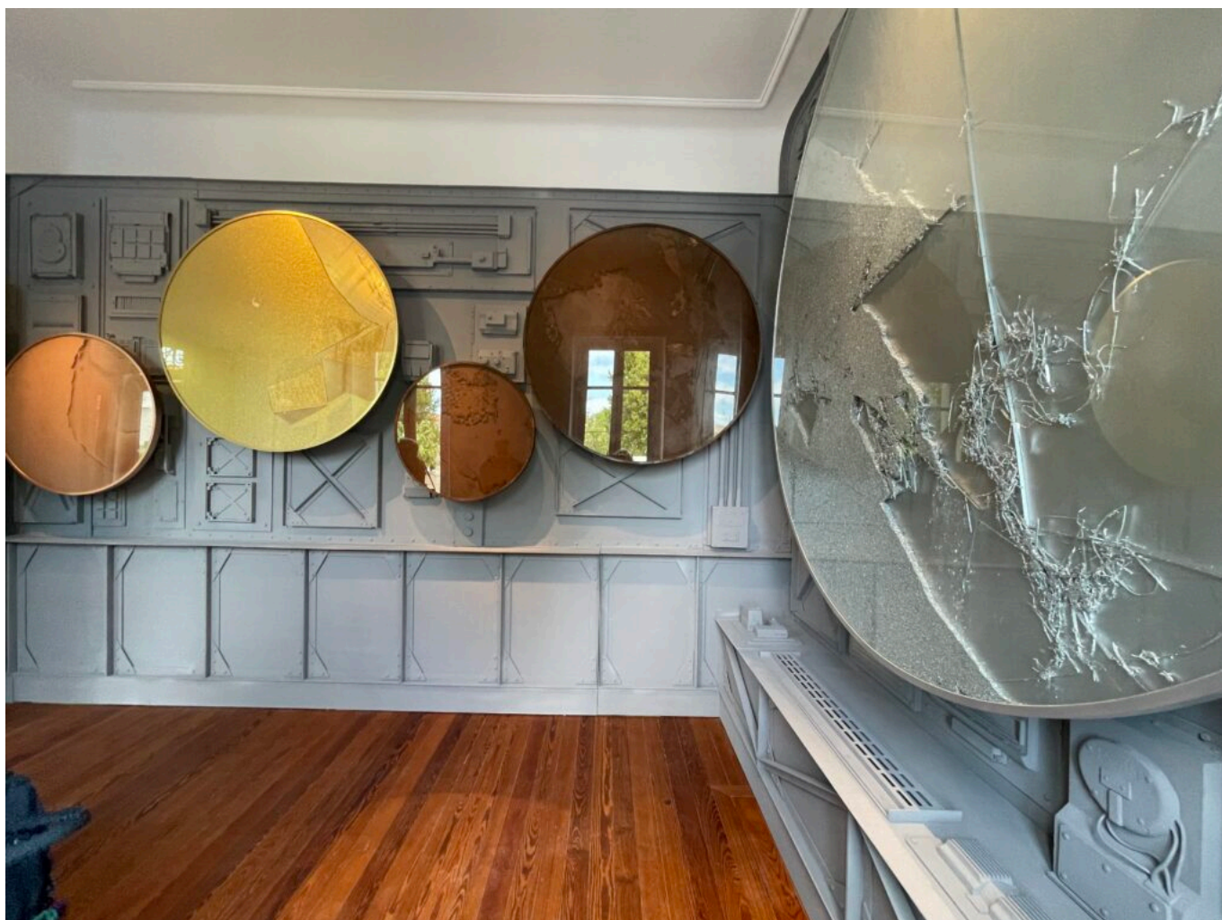
Matières métalliques de Manuel Merida, installation monumentale inédite, mouvement de matériaux dans 5 cercles, Copyright Mireille Hurlin

Ecrit par Mireille Hurlin le 12 juin 2023