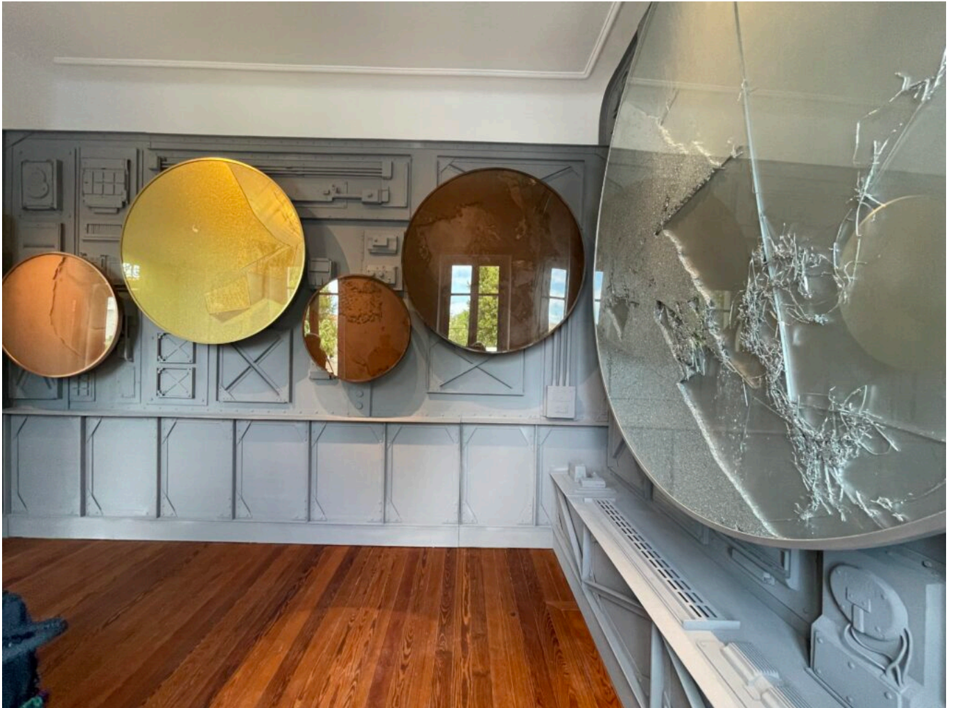
Matières métalliques de Manuel Merida, installation monumentale inédite, mouvement de matériaux dans 5 cercles

Ecrit par Mireille Hurlin le 12 juin 2023