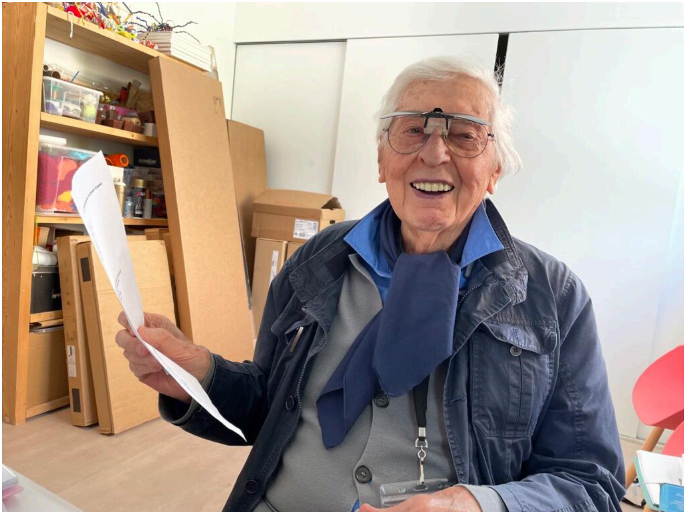
Julio Le Parc, Mai 2023, Villa Datris, Isle-sur-la-Sorgue