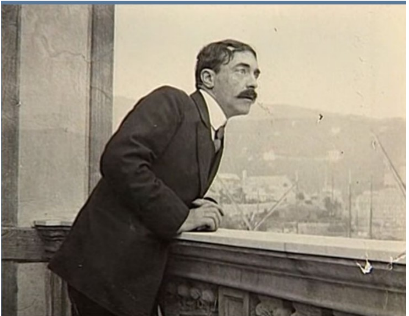
Paul Valéry