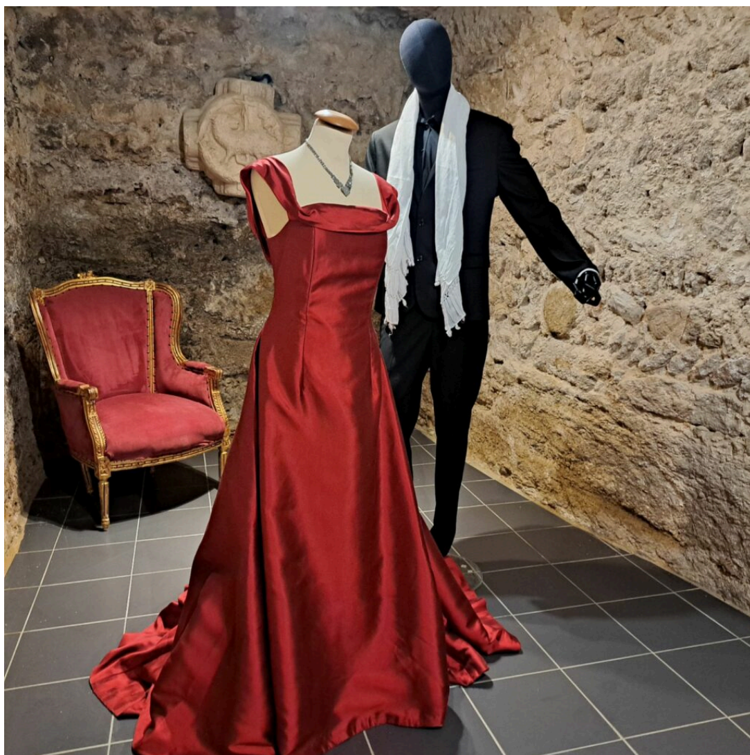
Costumes de La Traviata ©AB

Ecrit par Andrée Brunetti le 17 juillet 2024