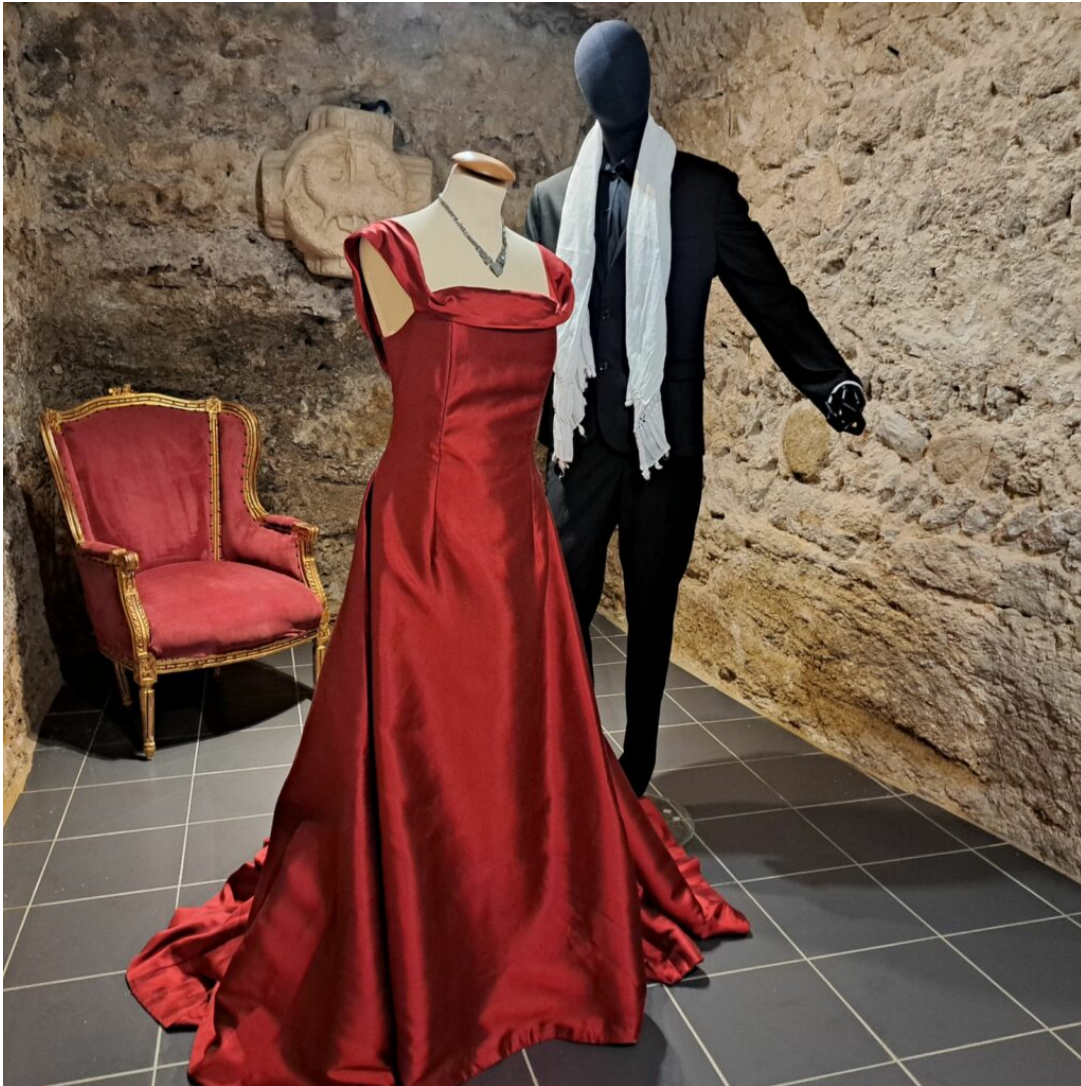
Costumes de La Traviata

Ecrit par Andrée Brunetti le 17 juillet 2024